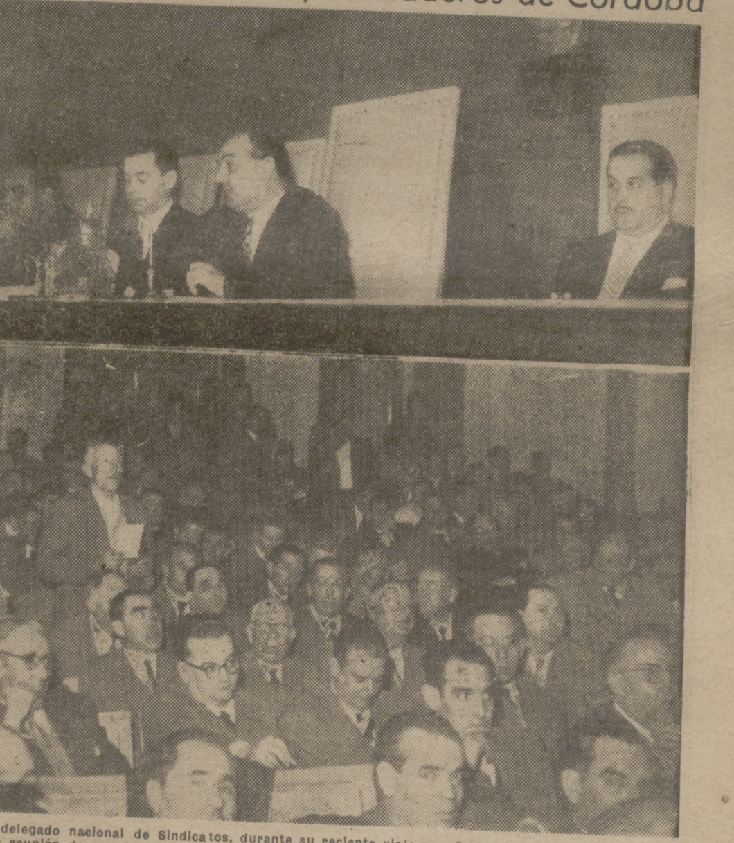
El delegado nacional de Sindicatos, durante su reciente viaje por Andalucía, presidió en Córdoba una reunión de mandos de la Organización Sindical de la provincia, y en la foto superior aparece dirigiéndoles la palabra. En la foto inferior, un labrador—vocal social de Hermandades— dialogando con la presidencia de la reunión sobre uno de los problemas tratados en el seno de la misma.

Clausuró ayer el delegado nacional de Sindicatos la Asamblea de Hermandades de Labradores y Ganaderos de Córdoba