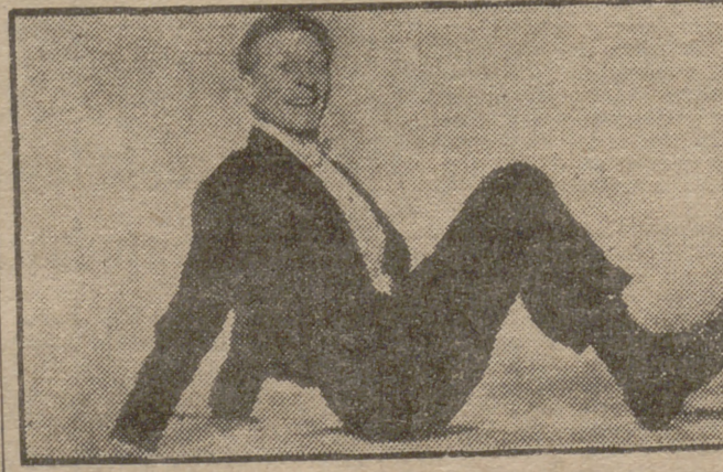
film "Un gramo de locura", en un mágico color por technicolor, Danny Kaye, el mago de la comicidad, es protagonista del jocoso de la triunfal marca Paramount