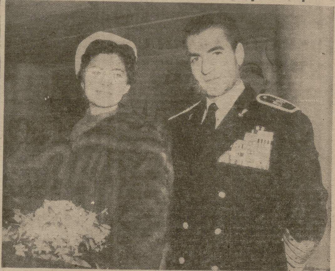
El Sha de Persia y su bella esposa, la Emperatriz Soraya, a bordo del trasatlántico "Queen Mary", que les trasladó desde Estados Unidos a Inglaterra, donde continuarán sus vacaciones. En la foto aparece el Emperador vistiendo el uniforme de jefe supremo de la Armada de su país; su esposa se cubre con un valioso abrigo de visón.