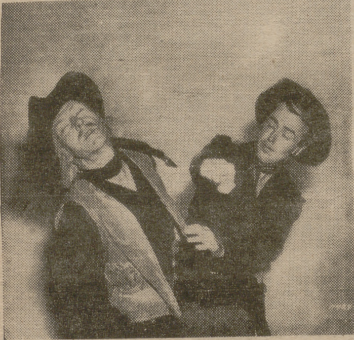
El próximo lunes la Paramount estrenará en la pantalla sensacional de Madrid, la del elegante Real Cinema, naturalmente, la gran película en color por Technicolor "Smith el silencioso", de la que es protagonista el admirado galán Alan Ladd, que aparece en la escena que reproducimos de este emocionante y espectacular film

Vuelve Alan Ladd, pero ahora al Real Cinema con "Smith el silencioso"