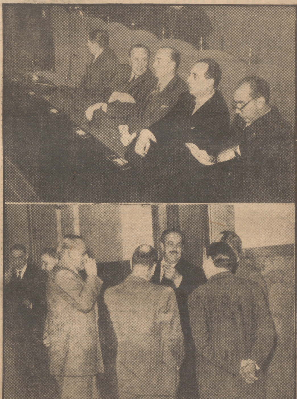
En el grabado superior, varios miembros del Gobierno durante la sesión celebrada ayer por las Cortes Españolas. En la otra, el ministro de Trabajo, señor Girón, conversa con varias personalidades momentos antes de dar comienzo la sesión plenaria.