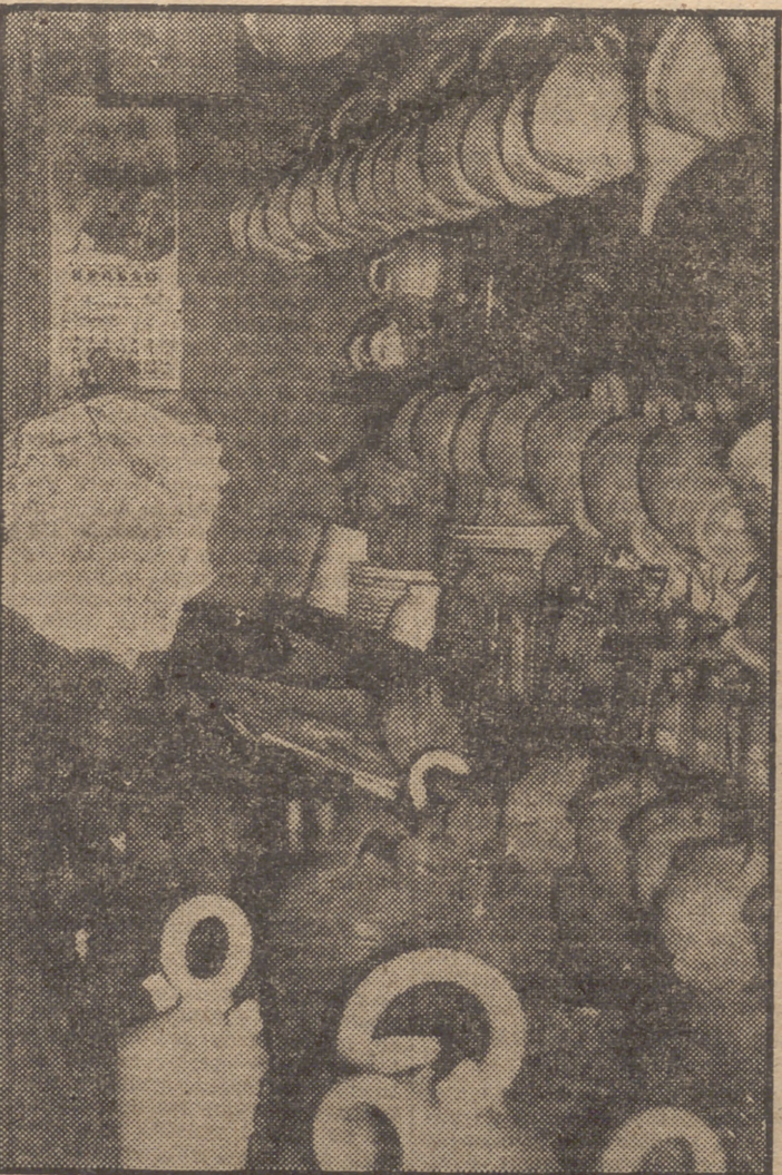
Escobas, tientos, botellas, cazuelas de barro... Verdaderamente, el que las cacharrerías son "arcas de Noé"

Frente al lujo de las tiendas modernas se alzan las típicas fachadas de las cacharrerías. Cuatro maderas, un escaparate iluminado por una única bombilla que cuelga de un flexible, y cacharros, muchos cacharros, cubiertos de polvo. En las estanterías se amontonan los objetos. Destacan los tientos modernos, con sus colores vivos y sus lados esmaltados. Ocupan los lugares destacados, parecen mirar con desprecio a los tientos de barro cocido que, encajados unos en otros, forman una torre, en un rincón de la tienda. Al entrar, una campanita, sujeta a la puerta, avisa a la dueña la entrada de un posible cliente. —¿Cuáles son las cosas de más venta? —Actualmente las macetas, las cazuelas de angulas y luego, en verano, los botijos. —¿Lo más caro? —Los tientos esmaltados. Algunos de ellos valen hasta 70 pesetas. —¿Y lo más barato?