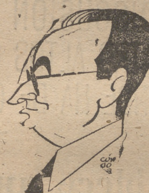
A LA VUELTA...