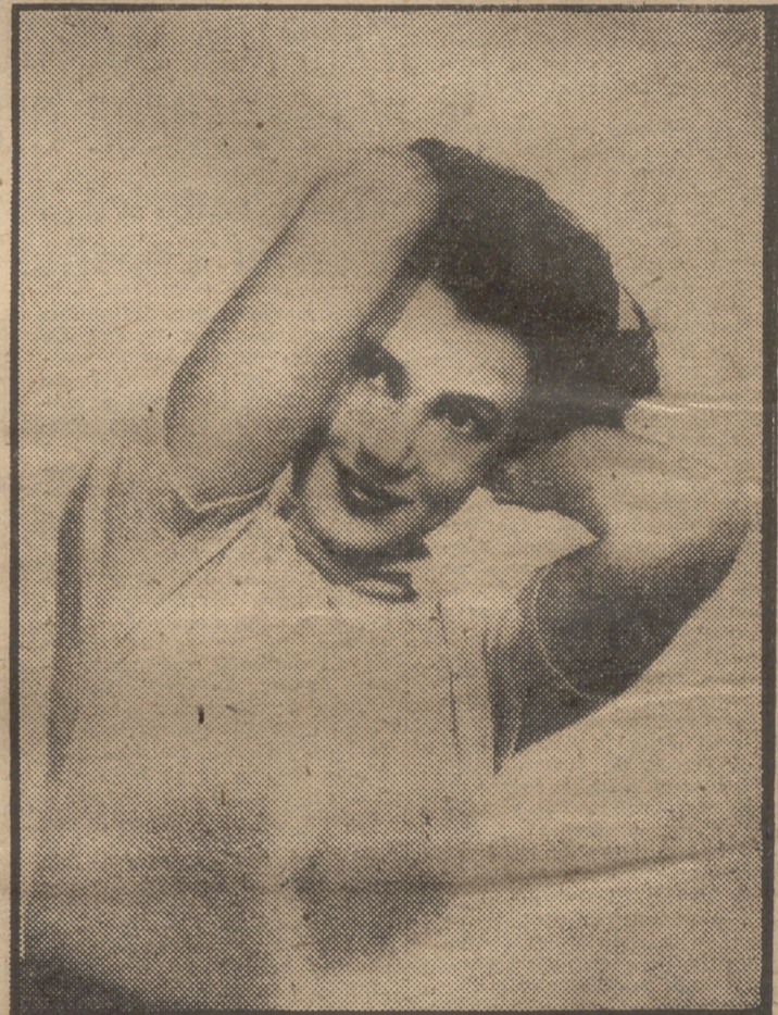
LA SEÑORITA TIENE CODOS Roberta Haynes se llama esta estrella de la Columbia Pictures, que tiene bonitos ojos, bonita sonrisa, bonito jersey y bonitos oídos. Y, como ven ustedes, todo lo luce graciosamente en este primer plano.