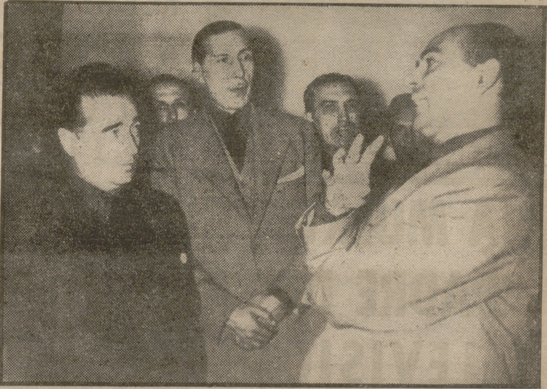
Don José Solís Ruiz, Delegado Nacional de Sindicatos, durante el acto de clausura del Consejo Económico Sindical de Murcia, cuya tarea ha presidido