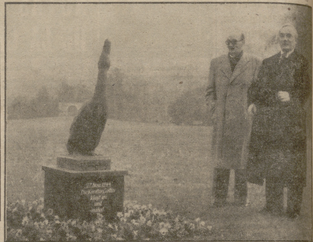
El 27 de noviembre de 1944, una formación de bombarderos aliados volaba sobre la ciudad alemana de Friburgo, dormida y silenciosa. Poco antes de que comenzasen a caer las bombas, un pato se puso a graznar tan desesperadamente que despertó a toda la vecindad, advirtiéndoles del peligro inmediato. La ciudad de Friburgo, en señal de agradecimiento, ha levantado en un bello parque la pequeña estatua al simpático palmípedo, que puede verse en la foto. En otra ocasión histórica fueron los gansos del Capitolio los que avisaron a los romanos de la presencia de los galos, salvando la ciudad. Definitivamente, la Historia también se hace con grazidos.