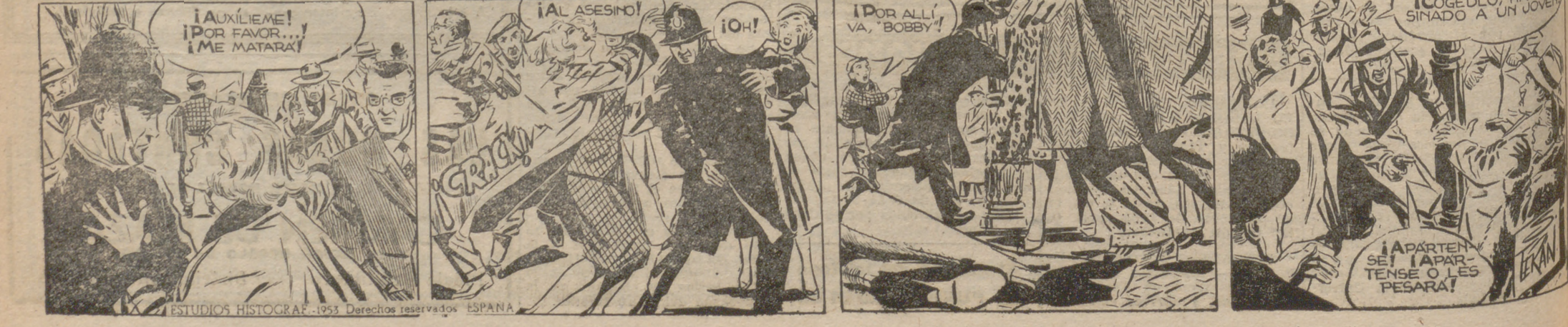
ESTUDIOS HISTOGRAF. 1953. Derechos reservados ESPAÑA