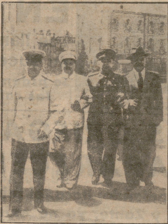
Esta fotografía ha circulado por todos los periódicos del mundo. Stalin va a la cabeza de "su grupo". Los tres que van del brazo y por la calle detrás del dictador son, de izquierda a derecha, Malenkof, Beria y Molotof. Era una mañana de sol, casi risueña. Beria iba asido a aquellos que después lo han destruido

Desde que asumió sus funciones —seguimos con la versión de la publicación extranjera anteriormente aludida—, en 1936, después de haber hecho desaparecer a su predecesor, Yegof, en un asilo de dementes, el efectivo de los