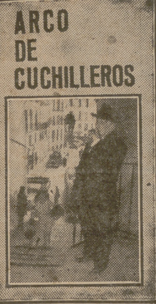
ARCO DE CUCHILLEROS