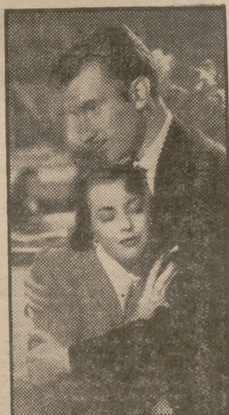
Margarita Andrey y Fernando Fernán Gómez en una escena de "Aeropuerto", una de las mejores películas de nuestro cine...