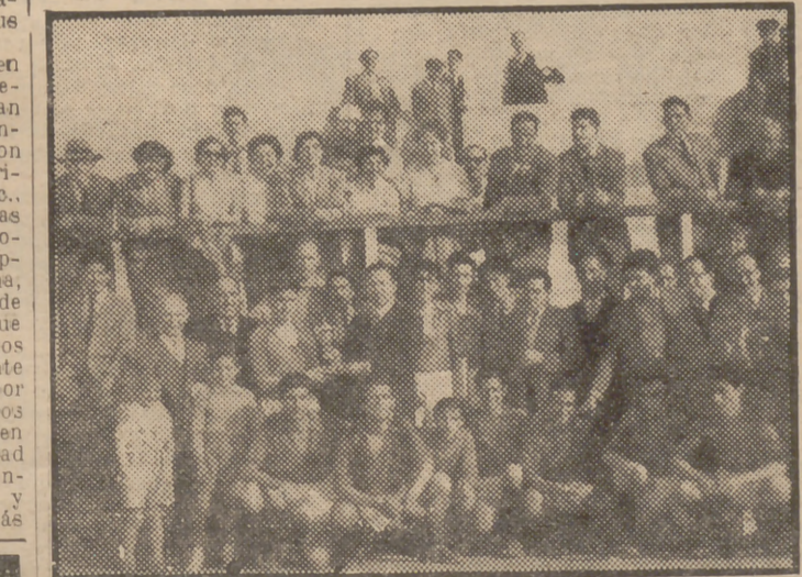
Con motivo de la festividad del Patrón de las Artes Gráficas se celebraron ayer varios actos deportivos, uno de los cuales fué un encuentro futbolístico entre los Grupos de Empresa de impresores del Magisterio Español y el de fotograbadores del Trust Gráfico, que terminó con el triunfo de éstos por 3 a 1. La fotografía recoge el momento en que el jefe del Sindicato Provincial entrega la copa al capitán del Trust Gráfico.