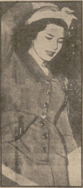
La bella Reina de Persia llega en avión a Roma, donde ha declarado que proyecta hacer un viaje por nuestro país.