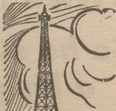
CRONICA de PARIS por Juan Pedro Luna

PARIS. (De nuestro corresponsal.)—Con la segunda vuelta, celebrada el pasado domingo, terminaron las elecciones municipales. Se mantuvo, como en la primera vuelta, la tendencia centrista y moderada, y si en algunos puntos ganan socialistas o radicales, se trata, más que de nada, de una cuestión de personas. Los comunistas, victoriosos en los grandes núcleos urbanos, pierden en los centros rurales. De todos modos, ese 25 por 100 de electores comunistas en Francia, alarma a los Estados Unidos. Conservan las Alcaldías de Stains, Arcueil e Ivry y pierden las de Lorient y de Oradur, que pasan a los socialistas. En algún punto, el alcalde socialista debió su elevación a gaullistas y moderados, que tuvieron sólo en cuenta la personalidad del designado y sus dotes económicas. Los independientes se llevan la gran tajada. Las coaliciones de radicales y hasta de socialistas con el R. P. F. han dado buen resultado. En cambio, allí donde los socialistas, atraídos por el canto de sirena de los de Moscú, se aliaron con ellos, fueron al desastre. Un ejemplo típico: Muret, provincia de Toulouse, es el pueblo donde pasó su juven-