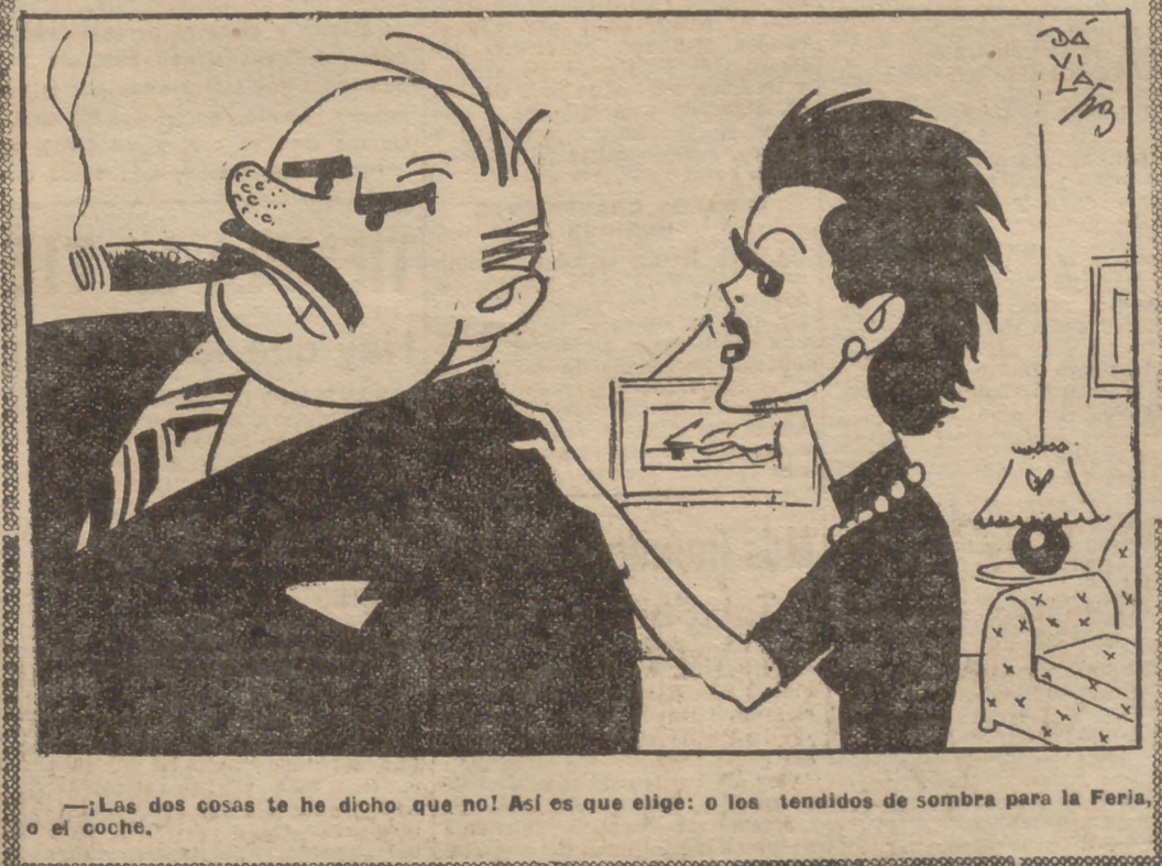
—¡Las dos cosas te he dicho que no! Así es que elige: o los tendidos de sombra para la Feria, o el coche.