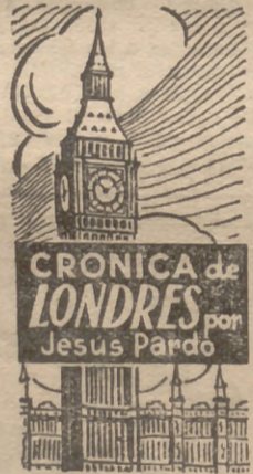
CRONICA de LONDRES por Jesus Pardo

DENTRO DE UNOS DIAS ¡¡OPERACION ¡¡LA BRUJA!!