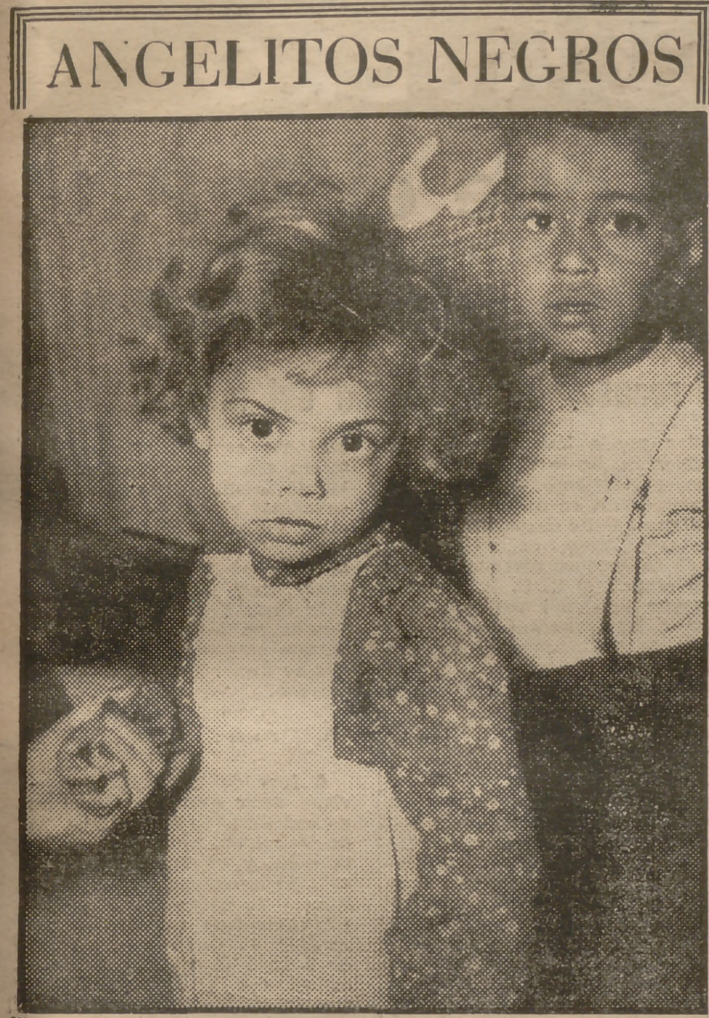
ANGELITOS NEGROS Alemania padece un nuevo problema, entre los muchos de la posguerra; uno más entre los muchos que se amontonaron súbitamente sobre el laborioso pueblo germano. Las tropas de ocupación integraron en sus filas muchos soldados negros, y éstos han dejado entre la población civil la huella de su paso. En la fotografía, dos niños de piel pigmentada, dos modernos "angelitos" negros, que, como en la canción, son queridos también por Dios y no mucho por los nombres. Protagonistas de un drama de incalculable hondura humana, estas dos criaturas han sido acogidas en un centro benéfico de Suiza. Parece ser que la presencia de estos desdichados seres sin hogar y sin calor paternal es más patente de lo que a primera vista parece. Son numerosos, según algunas informaciones, los niños negros desheredados.