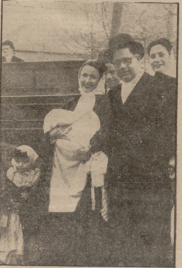
BAUTIZO CASTIZO Padrinos e invitados al bautizo del hijo del popular fotógrafo Aumente, ataviada ella, con el típico vestido de chulapona, y ellos con bombín, pañosa y pantalón abotinado, celebran el bautizo del neófito a los compases de un organillo. Después, en simones y manueles, se dirigirán a un restaurante de los Cuatro Caminos, donde entre churros y chocolate seguirá la fiesta.

La Reina Juliana ha expresado ante el micrófono la gratitud de los Países Bajos a todo el mundo libre por su ayuda y simpatía en el desastre de las inundaciones.