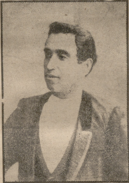
FERNANDO GÓMEZ (EL GALLO)

Alma de artista, gracia para llenar un redondel y espada de... cartón