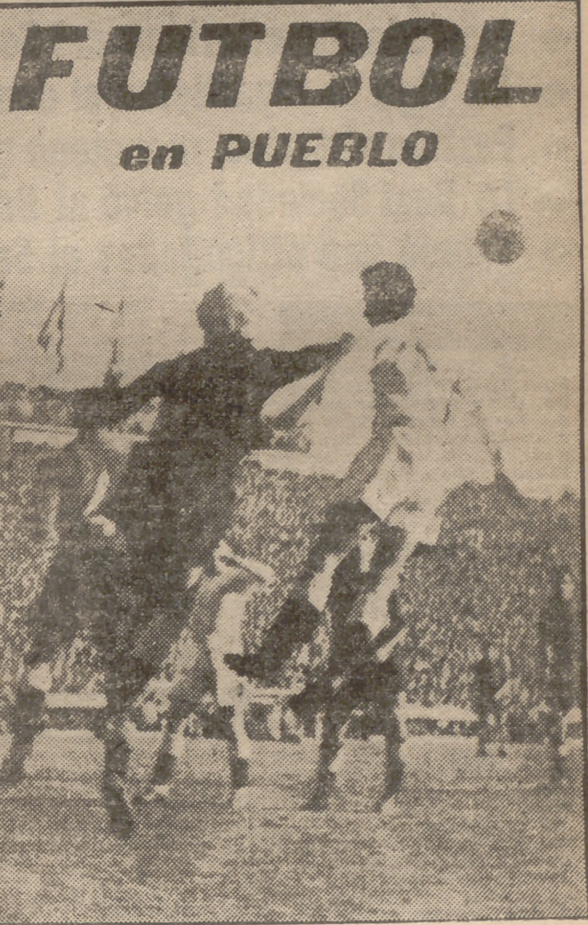
FUTBOL en PUEBLO