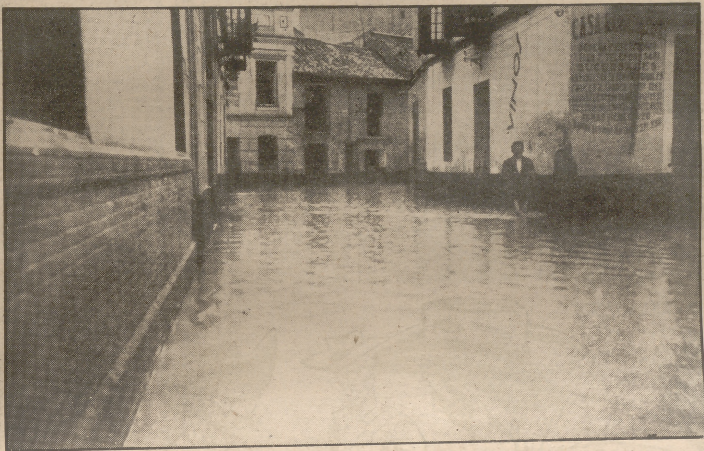
A consecuencia de la reciente tormenta caída sobre Málaga, las calles de los barrios y varias del centro sufrieron inundaciones como la que nos muestra la fotografía, que corresponde a la calle de San Jacinto, en el barrio del Perchel. El agua llegó a alcanzar hasta un metro de altura.

Slassen tiene a su cargo la misión de evitar la entrega de materiales estratégicos al bloque soviético, y el caso del "Wisma" es el primer ejemplo en el que se plantea la cuestión de si debe ser considerado como "acto de guerra" que hay que evitar. El "Wisma" debe navegar actualmente por el océano Indico, rumbo a la China comunista. Según explicación finlandesa, el capitán del vapor finlandés aceptó la carga como un caso aislado, sin creer que ello pudiera tener complicaciones