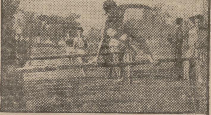
Prueba interregiones de preselección para el Cross de las Naciones. Un momento de la carrera en que los atletas han de salvar los obstáculos colocados en el recorrido.

AYER por la mañana, en terrenos de la Casa de Campo, se ha disputado la prueba de preselección en campo a través, para la formación del equipo español de senderismo que participará en el Cross de las Naciones, sobre la distancia de 13.500 metros. La clasificación ha sido la siguiente: