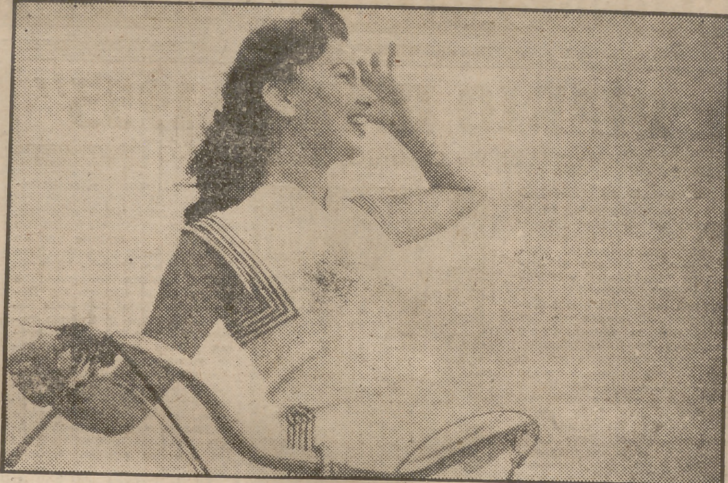
MIS CICLISTA 1953 En la ciudad Boca Ratón, de Florida, se ha celebrado un concurso para elegir la Reina de la Bicicleta. Aquí vemos a la ganadora después de haber pedaleado con otras concursantes.