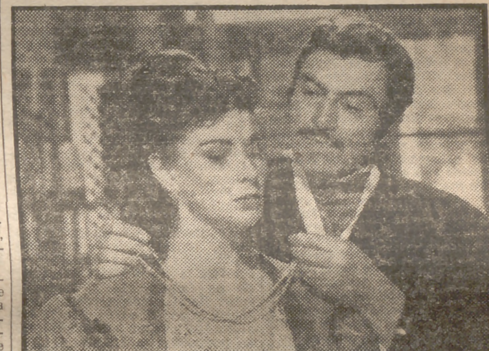
Alida Valli y Pedro Armendáriz en un primer plano del estupendo film "El tirano de Toledo", una de las historias más dramáticas que jamás imaginó escritor alguno...