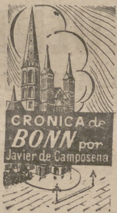
CRONICA de BONN por Javier de Camposena

Además, a él, que se ha convertido en el paladín de la defensa europea, no puede remorderle la conciencia. Tampoco le inquietan las posibles malas consecuencias que como alternativa ofrece la visita, ya que, por lo visto, considera que a Alemania y a Europa sólo les queda dos caminos: ratificación o catástrofe. Lo ha dicho muy claro con ocasión de su reciente discurso en Berlín.