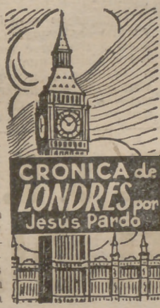
CRONICA de LONDRES por Jesús Pardo

Churchill, de vuelta de América, fué asaltado por preguntas en el Parlamento: "¿Que diga lo que ha tratado con Eisenhower! ¿Que nos lo cuente todo!" Churchill, sin embargo, se excusó: todas las conversaciones que mantuvo con estadistas americanos y con Eisenhower mis-