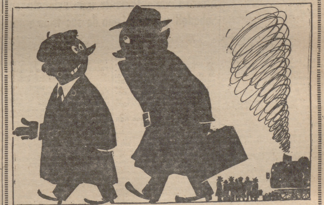
EL JUGADOR.—¡Hay que ver cómo "semos"! EL "HINCHA".—¡Es verdad! ¡Mira que "seis"!..!