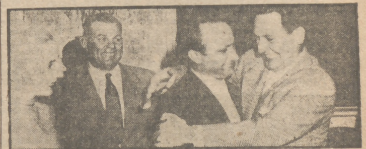
La foto recoge el momento en que el Presidente Perón abraza al corredor argentino Fangio, felicitándole después de uno de sus triunfos internacionales

El argentino Fangio, manifestó que correrá a más velocidad que ninguno