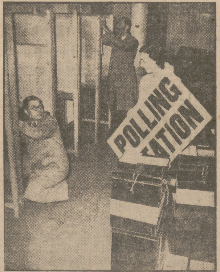
En la complejidad de los preparativos electorales en Inglaterra figura la disposición de las cabinas para los votantes. En la foto, la instalación de esas cabinas en el distrito de Westminster.