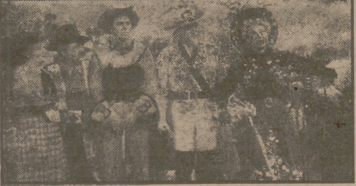
He aquí el conjunto de formidables artistas, capitaneados por la bellísima Betty Hutton...