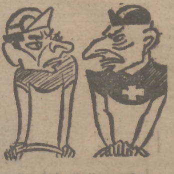
KUBLER Y KOBLET