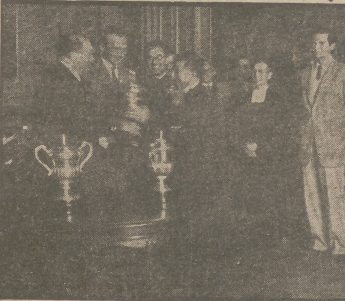
En presencia de los subsecretarios de Educación Nacional y Educación Popular, delegado nacional del Frente de Juventudes...