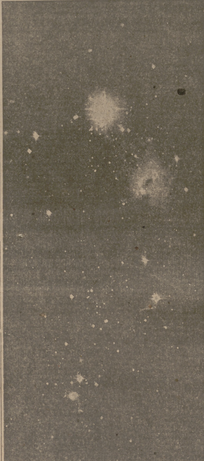
He aquí una impresionante fotografía de la Vía Láctea, el famoso "Camino de Santiago", brujula celeste de los peregrinos del medioevo. La Vía Láctea es un misterio para los astrónomos. En la presente foto puede apreciarse esa inmensa materia de apariencia gaseosa que impide a los telescopios más gigantes penetrar hasta el mismo centro de nuestro Universo.