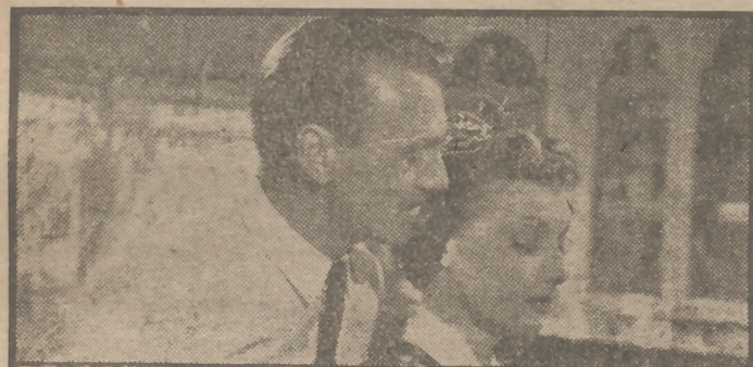
Ann Sheridan y Gary Cooper, pareja central del magnífico film "El buen Sam", que el lunes próximo se estrena en el cine Capitol.