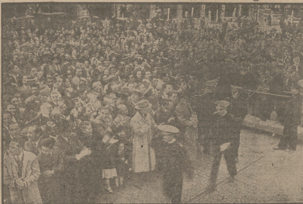
Los guardamarinas españoles son saludados con muestras de cariño por parte del público en el momento de descender en Buenos Aires del buque-escuela "Juan Sebastián Elcano".

camen de poder subsistido de su plumero, el ser escrito requiere todo esto es es- critor o tres o cuatro que el escrito todas par- tes y. Si se en- cierra no se ven o se pierden todas. No veo entonces, la única salida, el Estado pase a un número de que pueda tener no lo ha América po- dría lo de la pe- riódico.