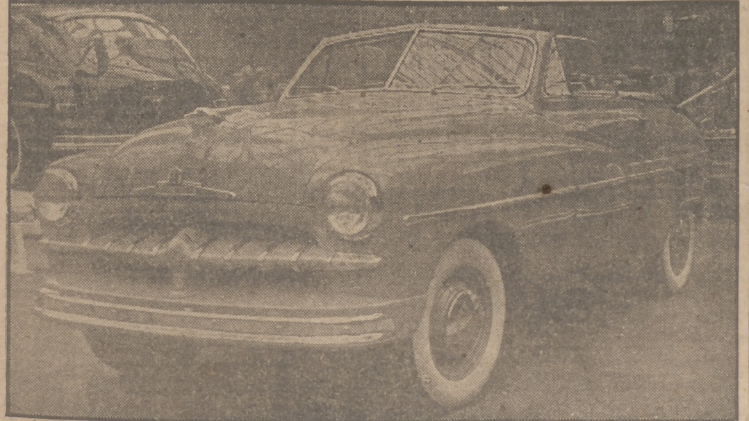
El Grand Palais de París acaba de inaugurar su XXXVI Exposición automovilística. He aquí la "Vedette" Ford, descapotable. El motor es de seis cilindros en V, a 90 por 100, caja de tres velocidades, con mando bajo el volante. Velocidad: 125 a 130 kilómetros por hora.