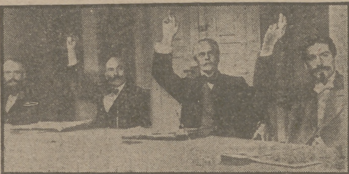
He aquí una escena del apasionante film "De hombre a hombres", verdadera joya del séptimo arte, que con caracteres de verdadero acontecimiento cinematográfico, y en función de gran gala, será presentada por Exclusivas Trián el lunes próximo en el cine Avenida.