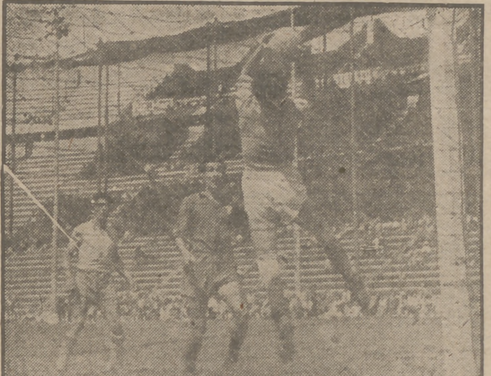
El día 2 se enfrentaron en Méjico el equipo nacional azteca con el equipo ecuatoriano Aucas. El resultado fué un rotundo cinco-cero a favor de los mejicanos. El conjunto vencedor pretende encontrarse con el Real Madrid en unos partidos de preparación antes de los campeonatos del mundo.