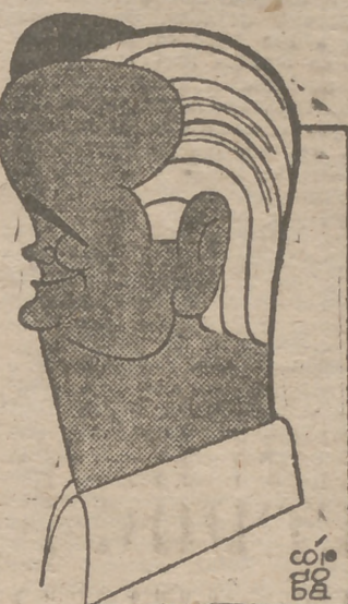
EL MAESTRO SOROZÁBAL

Con la opereta "Katiuska" debutó ayer en el teatro Calderón la compañía del maestro Sorozábal, compuesta por destacados elementos líricos y muy numerosa además.