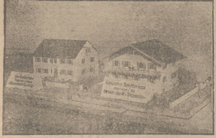
Maqueta de un sanario, a la derecha, y de una casa para cuatro familias que el famoso constructor de aviones, que llevan su nombre, va a levantar en Bonn, por un total de mil, gracias a un procedimiento especial y en un tiempo mínimo.