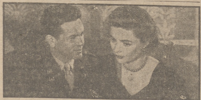
He aquí a Dorothy Mac Guire en una escena de la extraordinaria película "La barrera invencible", que con tanto éxito se proyecta en el cine Albéniz.

mienda un plato muy delicioso, originado en Holanda que se llama "bolas de nieve", y se prepara como sigue: