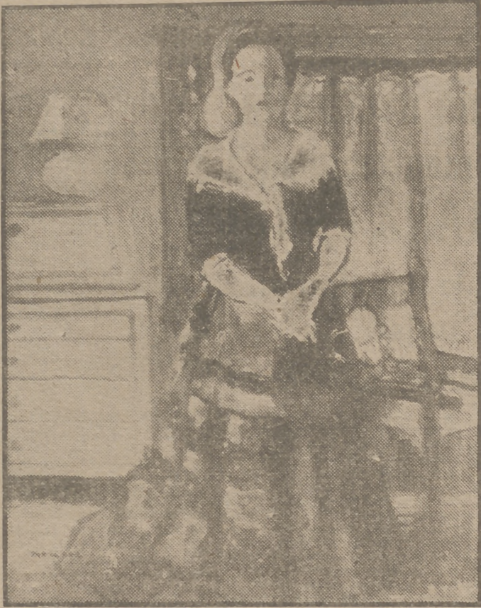
"Figura catalana", cuadro original de José Mompou.