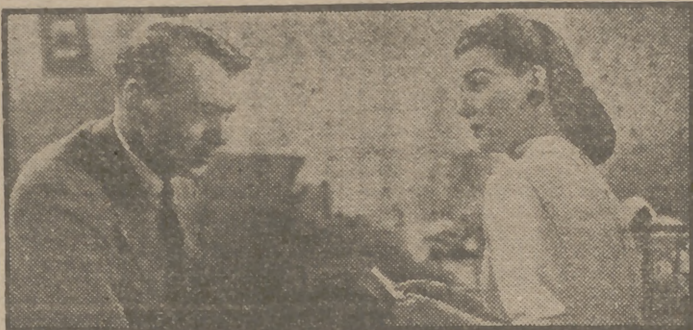
Ann Sheridan y Gary Cooper en una escena de "El buen Sam", película que muy pronto se estrenará en Madrid.