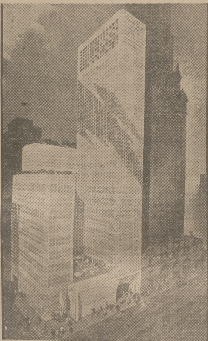
Las ciudades con rascacielos son objetivos a la medida para la bomba atómica. Imaginemos lo que puede quedar de esta elevada construcción después de una explosión de energía que planche los grandes núcleos de edificaciones.