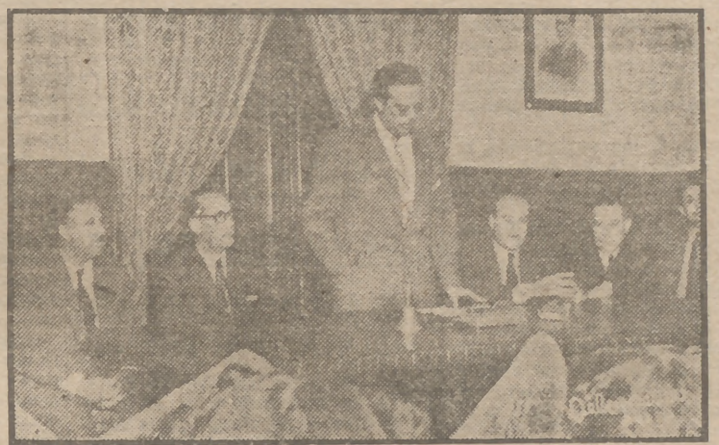
En el Colegio Oficial de Practicantes de Madrid se ha dado un curso sobre conocimientos profesionales de los practicantes de los deportes.