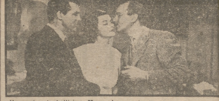
He aquí a la bellísima Myrna Loy, rodeada de los excelentes actores Cary Grant y Melvyn Douglas, en una escena de "Los Blandings ya tienen casa", divertida y cinécomedia irónica, basada en la vida real. Presentada por Cepicsa, triunfa en la pantalla del cine Capitol en su tercera semana de proyección.

Su último trabajo ante las cámaras lo realizó también en el rol de una muchacha sin escrúpulos, de costumbres bastante libres, la clase de chica que