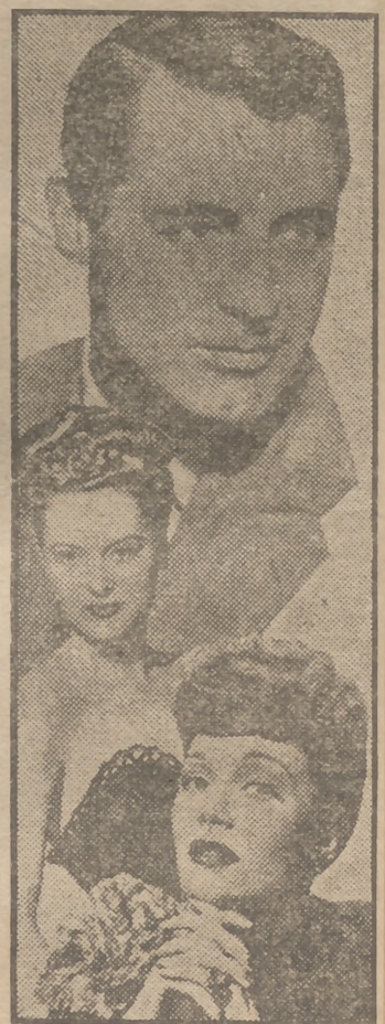
Cary Grant, Alexis Smith y Jane Wyman, el trio protagonista de la formidable superproducción musical en tecnicolor "Noche y día", que, presentada por Warner Bros, ha entrado en su segunda semana de proyección en los cines Paz y Calatravas