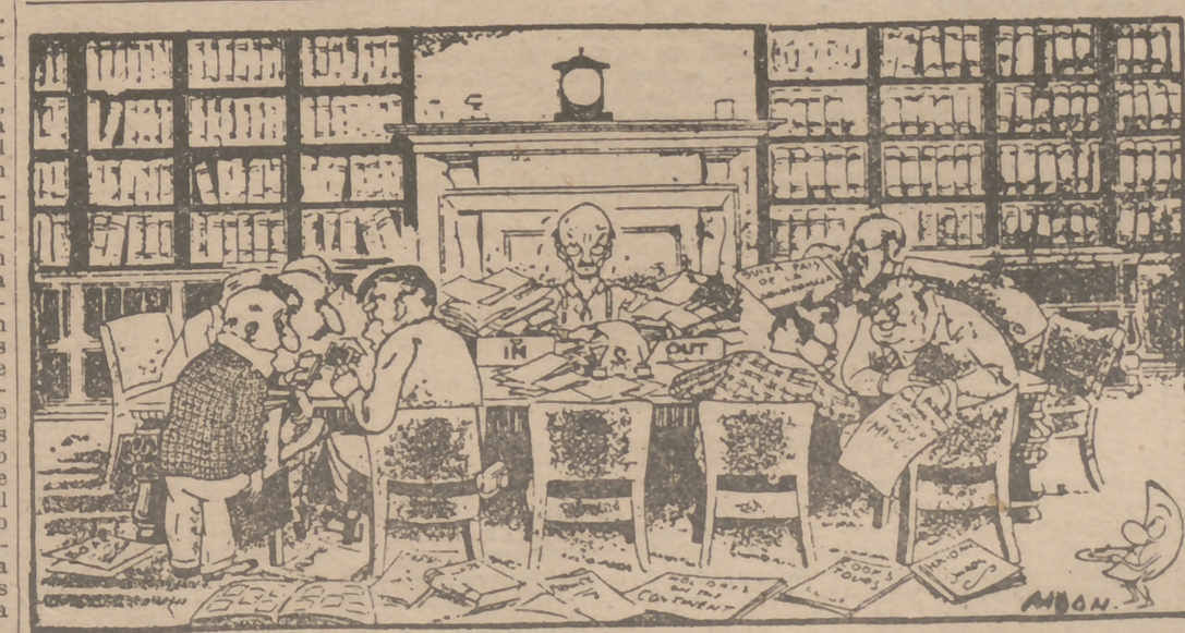
CONSEJO DE MINISTROS EN DOWNING STREET