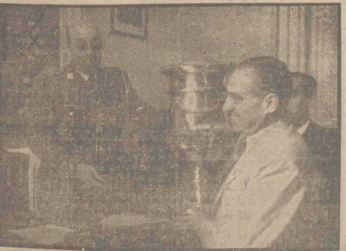
En la Delegación Nacional de Deportes se ha celebrado esta mañana el acto del reparto de premios correspondiente al año pasado. Presidió el acto el delegado nacional, teniente general Moscardó.