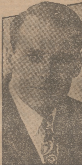
Henry Fonda, uno de los galanes más mirados y aplaudidos de nuestro público, es protagonista, junto a la no menos admirada actriz Claudette Colbert, del apasionante film "Corazón indomable", que desde mañana, viernes, se proyectará en los lujosos locales Paz y Calatravas.

Tino Rossi, el famoso cantante internacional, es su protagonista, secundado maravillosamente por Jacqueline Delubac, Madeleine Sologne y otras primerísimas figuras de la cinematografía francesa.