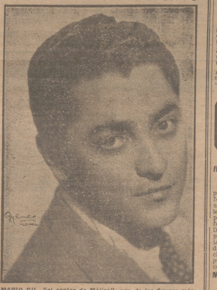
MARIO GIL, "el cantor de Méjico", una de las figuras más populares de la radio americana, que, acompañada por la Orquesta Rio Club, se presentará el próximo domingo, a las ocho de la tarde, en RADIO MADRID, en un programa extraordinario