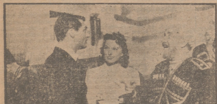
Cary Grant, Ginny Simms y Monty Woolley en una escena de "Noche y día", verdadera superproducción musical en technicolor, de gran éxito. Un torbellino de música, de hermosas mujeres y de canciones que nunca olvidará. Esto es "Noche y día", la gran película que la acreditada marca Warner Bros ha presentado en el cine Avenida con el mayor de los éxitos de público.