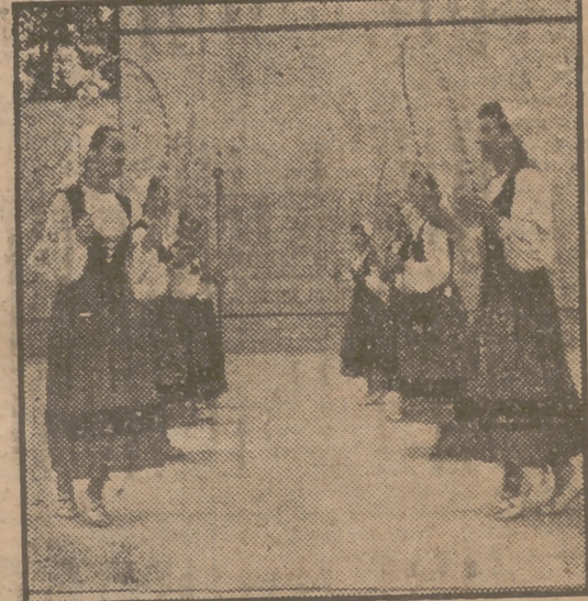
Organizado por la Obra Sindical Educativa y Descanso, semana un acontecimiento. He aquí las cantoras del País Gales y

Gran expectación ha suscitado en todo el mundo el anuncio del Concurso Internacional de Canciones y Danzas Populares que se celebrará en Madrid durante los días 29 del presente mes de mayo al 8 del próximo junio. Una ambiciosa empresa artística de amplio alcance organizativa supone la organización de este magna certamen que se verificará por iniciativa, y bajo los auspicios de la Delegación Nacional de Sindicatos, como contribución a la paz y a la comprensión de los trabajadores de todos los países. Muchas son las representaciones de trabajadores aficionados a la música, a la canción y a la danza de las más lejanas y bellas tierras que en estas fechas viajan hacia nuestra Patria para traernos en mostraciones líricas la expresión de sus más genuinos sentimientos raciales, artísticos y cordiales.