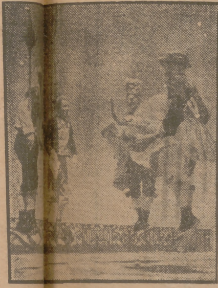
Descanso a semana próxima se celebrará en Madrid el Concurso Internacional de Canciones y Danzas, que promete constituir ras del País Gales y los grupos de "Art Basque", de bailarines, que han de participar en este gran certamen artístico.