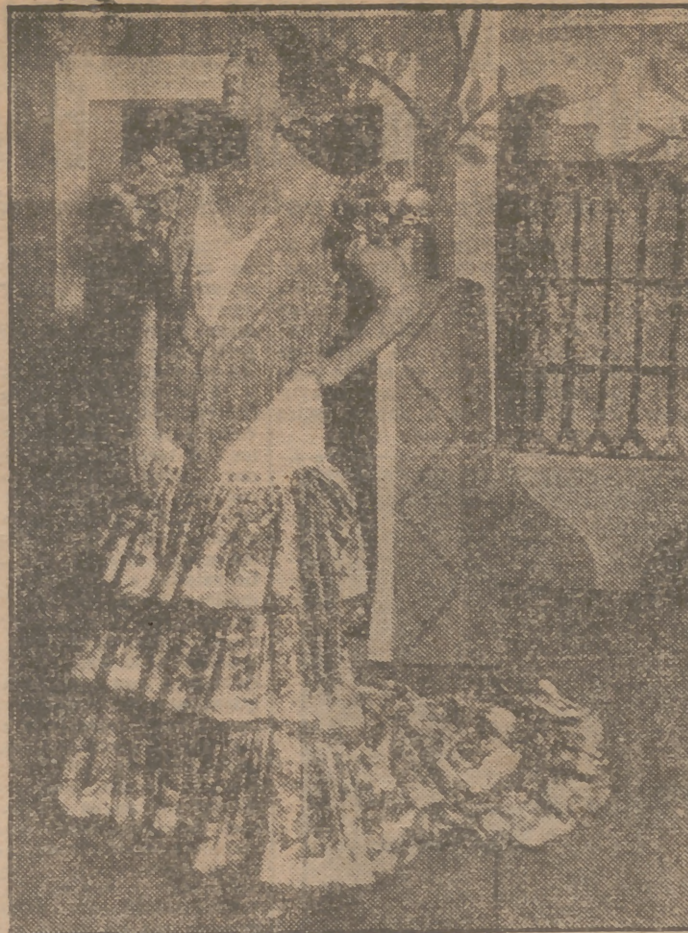
Conchita Piquer, primera figura de la canción española, es protagonista de "Filigrana", versión cinematográfica de la obra de gran éxito de igual título que hoy, jueves, se estrena en el suntuoso cine Coliseum.