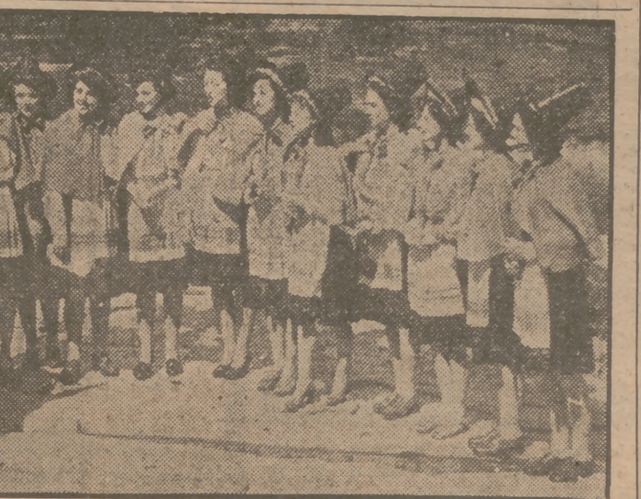
Descanso a semana próxima se celebrará en Madrid el Concurso Internacional de Canciones y Danzas, que promete constituir ras del País Gales y los grupos de "Art Basque", de bailarines, que han de participar en este gran certamen artístico.

LISBOA, 26.—Ha emprendido el regreso por vía aérea a los Estados Unidos el director del "Indiánopolis Star", Eugene C. Pulliam, acompañado de su esposa. El ilustrado periodista norteamericano, que ha estado escribiendo sus impresiones sobre España en más de 70 periódicos de los Estados Unidos, ha declarado al corresponsal de la Agencia Efe, momentos antes de partir en el aeropuerto de Portela: "Creo, sin titubeos, que se ha seguido una política francamente errónea en la O. N. U. con respecto a España. Mi opinión es que los Estados Unidos deberían sin dilación realizar una política de mayor aproximación a España, comenzando por restablecer en toda su plenitud las relaciones diplomáticas sin género alguno de restricciones. Es un gran contrasentido que ciertos países ataquen a España y se opongan a su admisión en la O. N. U. y al Pacto Atlántico, mientras que, por detrás de la cortina, a escondidas, la benefician de diversas maneras." (Efe.)