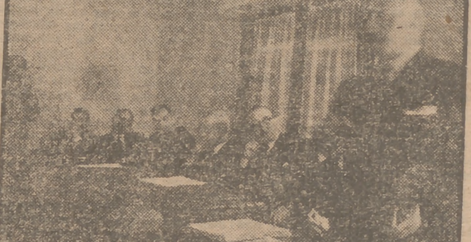
Un momento de acto celebrado esta mañana en la C. N. S., con motivo de la Asamblea de la Unión Territorial de Cooperativas del Campo de Madrid.

Por aclamación y entre gran entusiasmo fué reelegida la Junta rectora