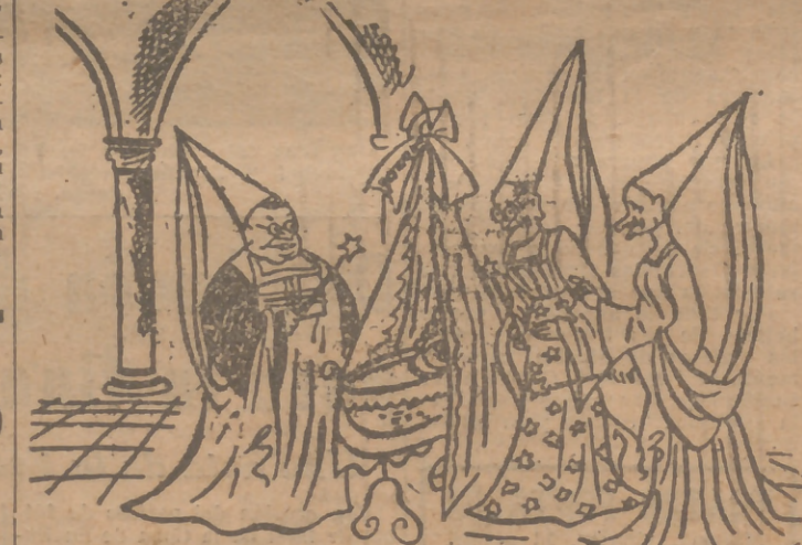
Atención! Empieza el ensayo general de la fábula "Bonn Alemania", inspirada en la Constitución de Bonn.