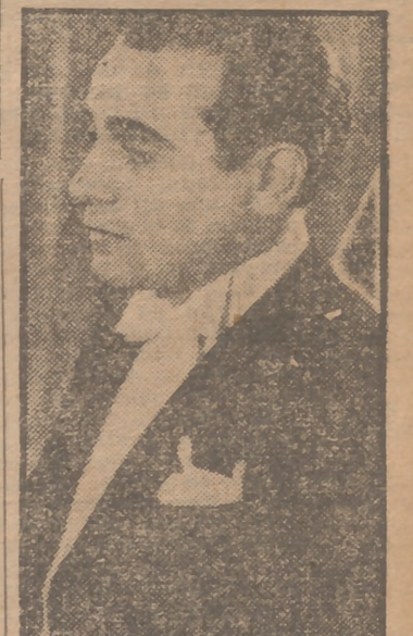
Tino Rossi canta las más bellas melodías modernas en "Fiebre en el alma", film presentado por Edici en la pantalla del cine Rex con éxito de público.

Y Thomas Gómez, con su buen humor característico, comenta: "Espero que el público no aprecie mi trabajo por mi canto; todavía creo que el actuar es mi fuerte".