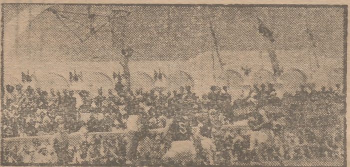
Una fase del encuentro de baloncesto entre las secciones de Portugal y España, celebrado en Tetuán con asistencia del Jefe.