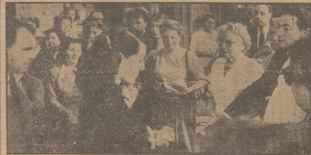
Esta es, posiblemente, la última fotografía tomada a Rita Hayworth antes de su boda "contra" el príncipe Aly Khan. El motivo fué la visita de esta famosa pareja a las Galerías de Arte de Cannes, donde se inauguró una Exposición de pintura. El elemento mirado entre admirativa y burlesca cuando abandonan el edificio de mayo, contraerán matrimonio en el Chateau de L'Horizon.

Se ha hecho diez vestidos de desposada LA BODA SE CELEBRARÁ EN FAMILIA, CON SOLO UNOS CUARENTA INVITADOS