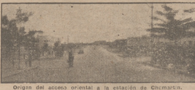
Origen del acceso oriental a la estación de Chamartín.

No se alterará la fisonomía exterior del paseo, y el túnel subterráneo irá también por Serrano y por Alfonso XII