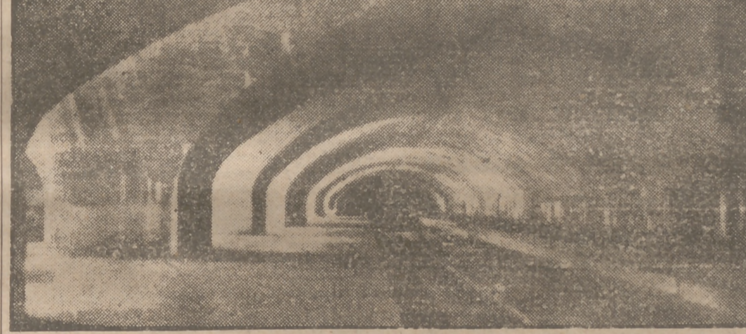
Una vista de los andenes de la estación de los Ministerios.