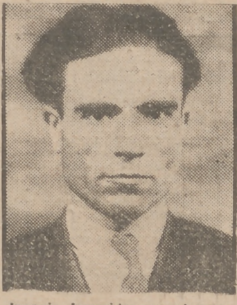
Ioannis Ioannides es el nuevo jefe comunista designado para reemplazar al destituido Markos, del que se dijo que se retiraba por enfermedad. Ioannides nació en Burgas (Bulgaria) en 1902, de padres griegos. Esta fotografía procede de las fichas policíacas de Grecia.

N O hubiesen sido mis anteriores artículos “voz clamante” por la institución del Teatro para el Pueblo más que humo de divagaciones perdido en la indiferencia si no precediesen al propósito de articular una idea en propuesta. Hoy vamos a ver si es caro o barato, sencilla o difícil dotar a las gentes laboriosas del mejor y mayor medio de hacer florecer su ocio.