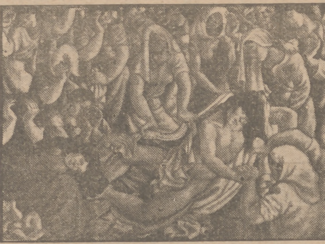
Una de las obras más características de Jesús de Perceval, el nombre más representativo de la pintura indiana.