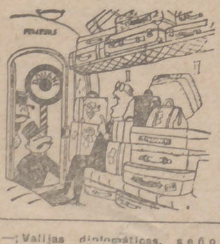
—Valijas diplomáticas, señor aduanero!

“Los negros no se diferencian de los blancos más que en el color”