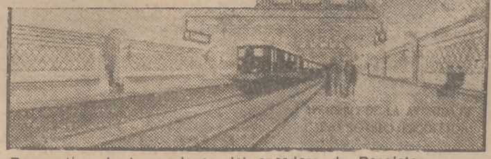
Perspectiva de los andenes del apeadero de Recoletos.

EL madrileño se venía preguntando: ¿Qué pasa con el túnel de los enlaces ferroviarios? Desde hace algún tiempo no se observa movimiento alguno de trabajo, al menos en el exterior. La Prensa se ocupó de esto, y entonces se nos dijo que se estaba estudiando la modificación del trayecto de los enlaces ferroviarios. ¿Se volvería al proyecto de llevar ese ferrocarril por el subsuelo de la calle de Serrano? Ahora acaba de ser publicada una documentada Memoria sobre este gran estudio técnico, y en ella se dice: "No es éste el momento de que nadie pueda pensar en la modificación de sus líneas—las de los enlaces—esenciales. No cabe razonablemente en la situación actual tratar de volver a soluciones estudiadas en su día y que no fueron aceptadas, ni tampoco tomar como motivo de queja y base de crítica, entorpecedoras de los trabajos, algunas molestias circunstanciales durante la construcción y fácilmente llevaderas y de poca monta si se las compara con la magnitud de las obras y la inmensa ventaja que las mismas han de aportar."