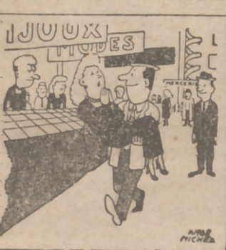
—El parroquiano siempre tiene razón... siempre... siempre.