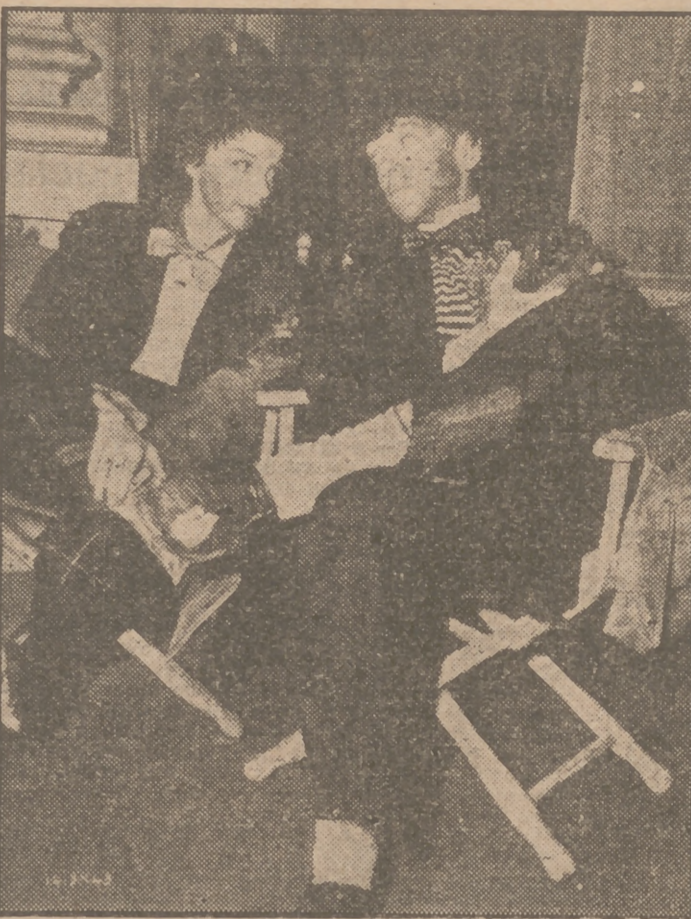
Judy Garland parece decirle al formidable bailarín Fred Astaire "No estás nada guapo", y oremos que, por su parte, Astaire le responderá a la encantadora Judy: "Pues tú se conoce que no te has mirado al espejo". Esta fotografía corresponde a la película musical en technicolor de la M. G. M. "Easter parade", actualmente en rodaje en los Estudios de Hollywood.