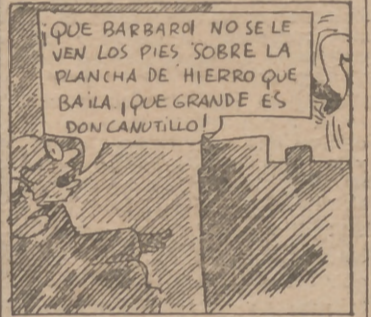
¡QUE BARBARO NO SE LE VEN LOS PIES SOBRE LA PLANCHA DE HIERRO QUE BAILA, ¡QUE GRANDE ES DON CANUTILLO!