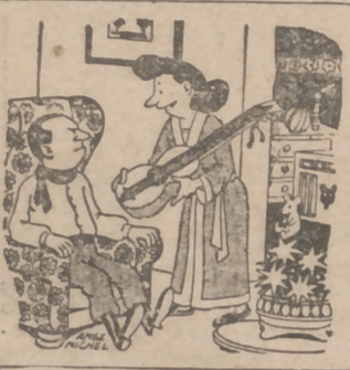
—Anda, toca para dormir al niño.