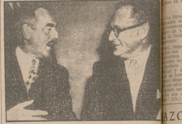
El secretario de Estado de los Estados Unidos, Dean Acheson (izquierda) recibió al ministro de Negocios Extranjeros noruego, Halvard Lange, en el Departamento de Estado de Washington, el día 7 de febrero, para discutir la actitud de Noruega con respecto al Pacto del Atlántico.