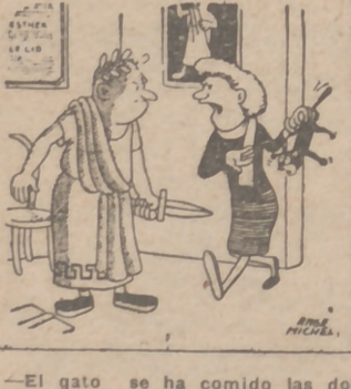
—El gato se ha comido las dos chuletas; échale en cara eloquentemente su indignación.