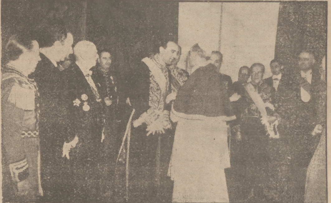
Con motivo de la protesta hecha por el Cuerpo diplomático acreditado cerca de la Santa Sede, por el proceso contra el cardenal primado de Hungría, Mindszenty, Su Santidad Pío XII concedió una audiencia a los miembros del citado Cuerpo. El grabado recoge el momento en que el embajador de España, señor Ruiz Jiménez, besa el anillo del Papa.