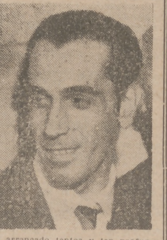
—Eduardo Vicente, pintor español que ha vivido en los Estados Unidos.

N O vamos a empeñarnos aquí en hacer un descubrimiento de las calidades que cualquiera ve sin mucho esfuerzo en los cuadros de Eduardo Vicente. Es harto conocido este joven pintor y sus obras han sido celebradas más de una vez en España y fuera de España como merecen. Nosotros solamente queremos decir a nuestros lectores que nos ha enviado unas cuartillas para que conozcan algo de su opinión acerca de la vida en Norteamérica. Eduardo Vicente ha vivido en los Estados Unidos seis o siete meses, pensionado por la Academia de Bellas Artes. Eduardo ha recorrido el país con su atención siempre despierta y se ha fijado ante todo, como es natural, en lo que más le importa, en los Museos, en las Exposiciones y en todo lo que de alguna manera tiene relación con el arte y en particular con la pintura. Ya tenemos muestras estupendas de sus observaciones en los últimos lienzos salidos de su pincel. Eduardo Vicente recoge en ellos sus impresiones fugitivas de esa vida que se hace y se deshace todos los días en las grandes ciudades americanas y nos las brinda como muestra de sus experiencias artísticas y como nueva cantera que va a ofrecer quizá nuevos recursos a su arte.