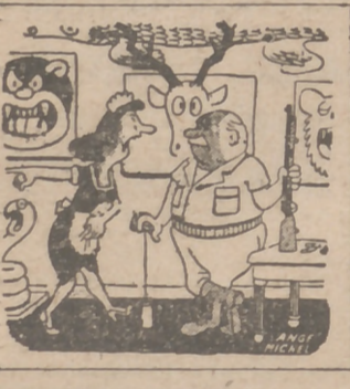
—Señorito, venga pronto con las armas, hay un ratón en la cocina.