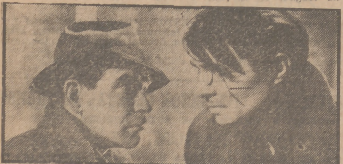
Robert Newton y James Mason, los celebrados actores británicos, en una escena de "Larga es la noche", el gran éxito cinematográfico de la presente temporada, que se proyecta en el elegante Real Cinema.