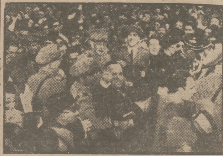
NUEVA YORK.

WALTER LIPPMANN cree necesario otro sistema de control en Alemania