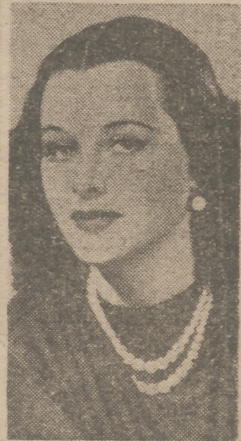
Hedy Lamarr, más bella y seductora que nunca, la veremos junto al admirado actor Spencer Tracy en "La vida es así", divertida comedia de la Metro Goldwyn Mayer, que en breve se estrenará en Madrid.