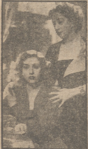
PRESENTA A Edwige Feuillere en MIENTRAS VIVA