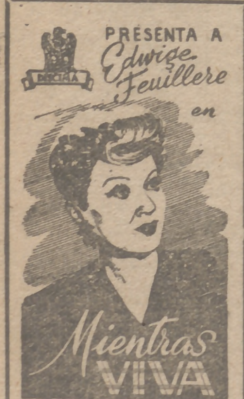
EN SU MAXIMA CREACION CINEMATOGRAFICA LLEVADA A LA PANTALLA Distribuida por PENINSULAR FILMS