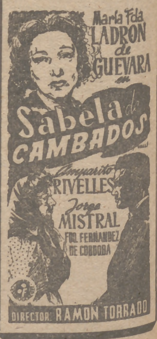
DIRECTOR: RAMON TORRADO