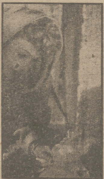
Edwige Feuillère y Jacques Berthier en una escena del apasionante film de gran éxito "Mientras viva", que muy pronto será presentada a nuestro público por Peninsular Films.

venial realización de Victor Fleming, obra maestra de la cinematografía moderna. Jamás pudo decirse que ninguna película con tanta veracidad como "La vida es así" que es un film distinto a todos los demás. Todos los que la han visto han quedado maravillados ante la originalidad. Y todos los madrileños muy pronto quedaremos asombrados ante tan magnífica expresión del arte a que ha llegado el cine moderno. "La vida es así" constituirá el verdadero acontecimiento cinematográfico del año.