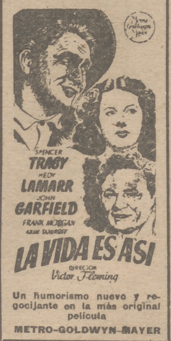
Un humorismo nuevo y regocijante en la más original película METRO-GOLDWYN-MAYER