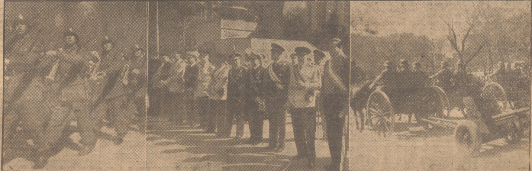
En esta información gráfica recogemos distintos aspectos del desfile militar celebrado hoy, Día de la Victoria, en el paseo de la Castellana. Vemos arriba a nuestro Caudillo en el momento de descender del coche al pie de su tribuna, y en las otras fotos, dos detalles del paso de distintas unidades ante la tribuna del Generalísimo, y en el centro, el Gobierno en pleno espera la llegada del Jefe del Estado.

Mr. Taylor permanecerá en Madrid dos días, y después partirá para Roma. Mañana, a las once, se entrevistará con monseñor Cicognani.