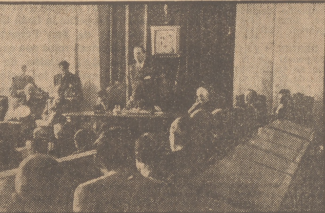
El ministro de Agricultura, con las autoridades malagueñas, en el acto de inauguración del Consejo Económico Sindical celebrado en Málaga.