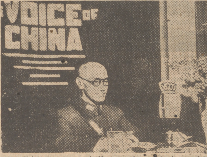
Chan-Kai-Chek, ante un micrófono, en el momento de anunciar a su pueblo la rendición incondicional del Japón.

III DONALD bombardeaba casi diariamente a Chan con estudios sobre los maes económicos y políticos de China.