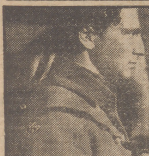
Reproducimos una escena de la espectacular película de gran éxito "La hija del capitán". Son figuras centrales de este magnífico film la bellísima actriz Irasema Dillian y el formidable actor Amadeo Nazzari.

con que nos demuestra su equivocación, por ejemplo, al cortejar a Pat, creyendo que es su hermana. O cuando vive la personalidad del esposo prudente, reconcentrado, comprensivo y tolerante, pues jamás llegó a dirigir una frase ofensiva a Kate.