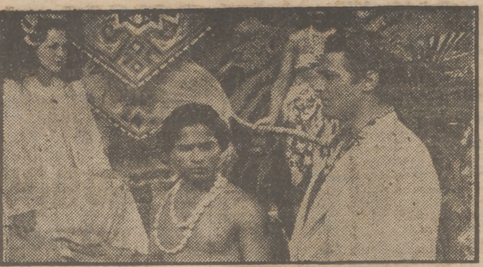
María Montez, Sabú y Jon Hall en una escena de la formidable producción en tecnicolor "La salvaje blanca", que con gran éxito de público se proyecta en el cine Avenida.