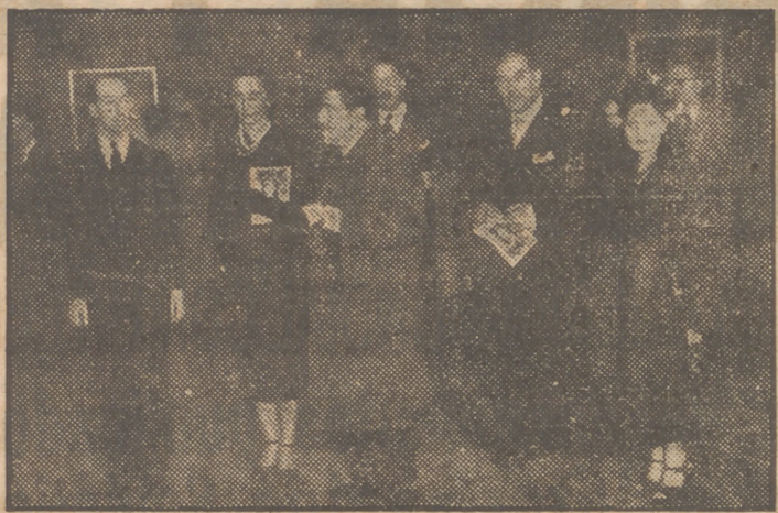
El director general de Bellas Artes y otras personalidades del mundo artístico y de la colonia francesa en Madrid durante la inauguración de la Exposición de obras del pintor Marc du Plantier en el Museo de Arte Moderno.