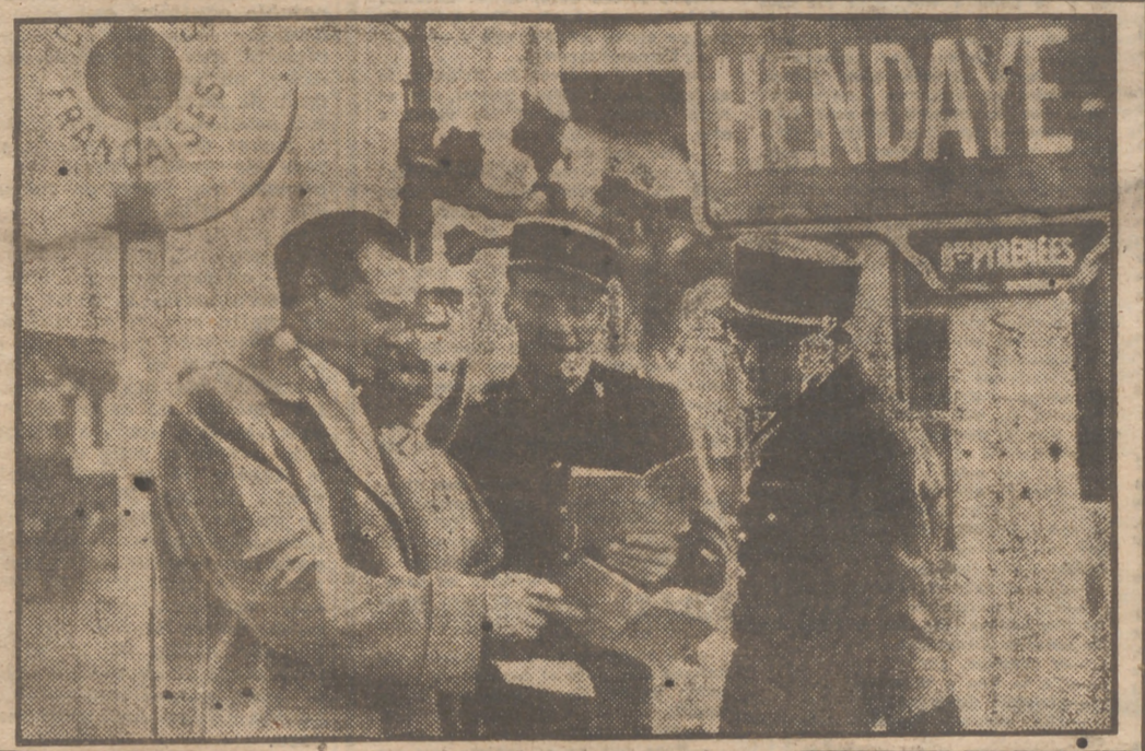
El dramaturgo francés Marcel Pagnol y su esposa, en el momento de presentar sus documentos en la frontera española, en Hendaya, la cual cruzaron el día 9 de este mes camino de Portugal. La frontera francoespañola, que había permanecido cerrada durante dos años, quedó abierta de nuevo al tráfico a media noche del día 9 de febrero.

TURISTAS PROCEDENTES DE PORTUGAL, EN LA FRONTERA HISPANOFRANCOESA