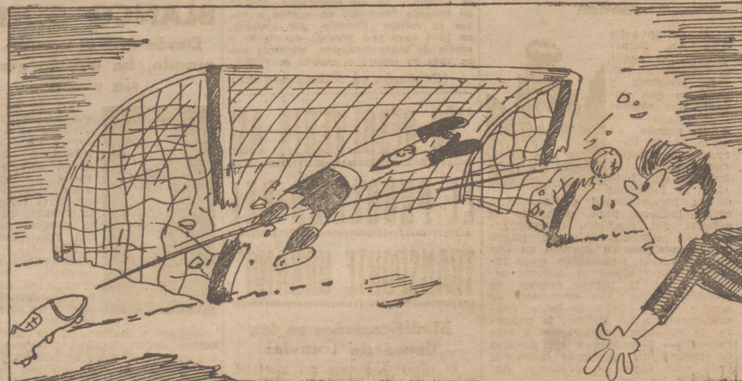
El auténtico cañonazo cruzado