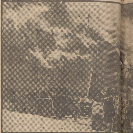
Sobre las llamas de la iglesia del Sagrado Corazón de Massachusetts, la cruz parece alzarse como símbolo de la fe. El fuego destruyó todo menos las paredes de gres y la de acero. Las pérdidas alcanzan el medio millón de dólares.