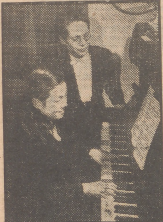
La señora Chiyo Sakakibara es la primera mujer que ocupa el cargo de ministro en el Japón. Ha sido fotografiada en su casa de Tokio mientras dirigía una lección de piano de su hija Ryo.

Núcleos árabes controlan la zona de Samaria Memorándum sobre la desintegración de los SERVICIOS ADMINISTRATIVOS