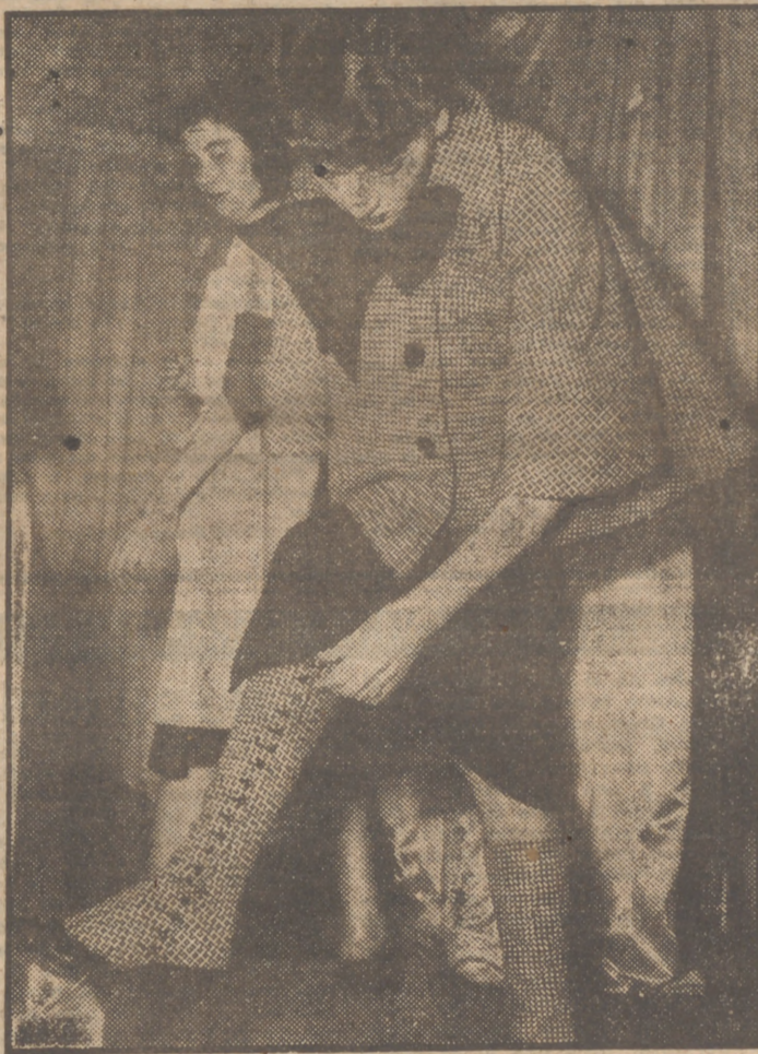
En preparación de la Exposición de modas que ya se celebra en París, una modelo se ajusta las polainas que forman parte de su “ansamble”. El “paletot de lana a cuadros blancos y negros hace juego con las polainas, o viceversa. Bajo el “paletot”, la modelo lleva un vestido de lana. El efecto se realiza con un gran lazo negro en el ovello.