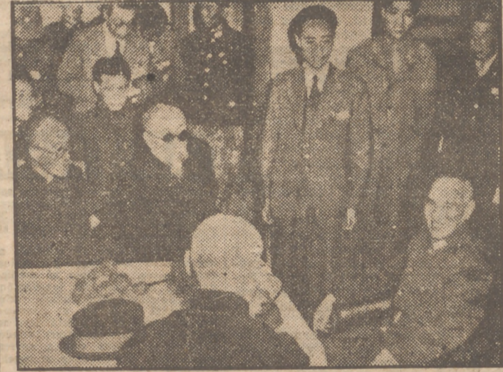
El jefe nacionalista chino en una entrevista celebrada en Manchuria durante una tregua de la guerra civil.

En octubre de 1934, Donald iba en el tren de los Chan. En la estación de Lo-Yang dijo al Generalísimo: "Si usted dispusiera que la locomotora cambiase de lugar y se enganchase a la cola del tren, en vez de ir a Hankow, mañana a estas horas estaríamos en la ciudad de Sian."