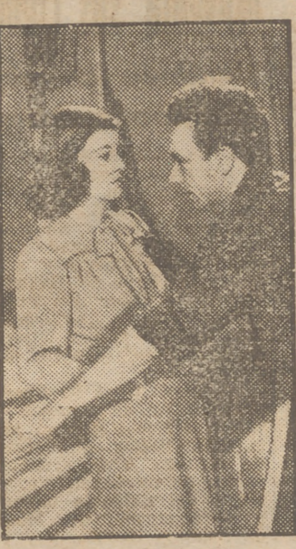
He aquí a la excepcional actriz Bette Davis y el magnífico actor Dane Clark en una escena de "Una vida robada", formidable creación de la sin par Bette Davis. Para el lunes próximo, Astoria anuncia el estreno de "Una vida robada", en el cine Capitol.

Empresas de más categoría se han interesado vivamente por "Una mujer internacional", ilusionados por el gran éxito obtenido en todo el mundo. Pero con el estreno de esta película va a suceder un caso auténticamente excepcional en nuestra historia cinematográfica: un cine magnífico de Madrid, no emplazado en la Gran Vía, pero sí en el lugar más céntrico y señorial, que está reconocido como uno de los mejores de Europa, es el que, causando asombro en todos los ámbitos del cine madrileño, ha conseguido, después de tremenda lucha, la exclusiva de estreno en Madrid. Esta soberbia película, "Una mujer internacional", maravillosamente interpretada por George Brent, Itona Massey y Basil Rathbone, será estrenada en nuestra capital dentro de breves días.