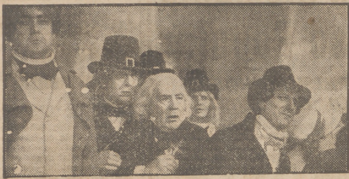
La guillotina va a cercenar otra cabeza más. He aquí una escena del espectacular film "El orimen del correo de Lyon", que Confisa presenta hoy, jueves, en el cine Imperial.