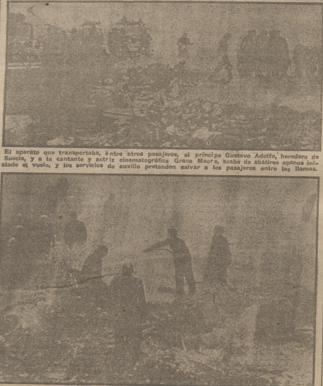
El aparato que transportaba, entre otros pasajeros, al príncipe Gustavo Adolfo, heredero de Suecia, y a la cantante y actriz cinematográfica Grace Moore...