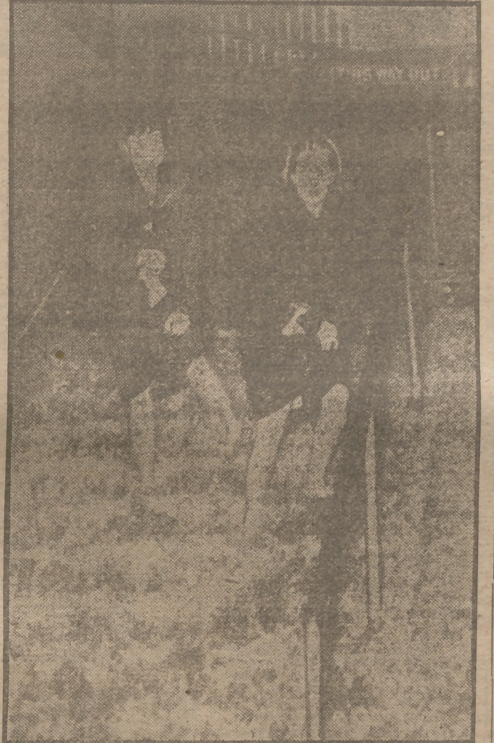
Debido a una rotura de las cañerías, ha quedado inundada una estación del Metro en Filadelfia, lo que ha dado lugar a escenas pintorescas como la que reproduce la fotografía. Dos viajeros del "Subway" se ven obligados a buscar la salida a través del "río encalmado" en que se ha convertido el acceso, con los zapatos en la mano, pero llevando la aventura con gesto deportivo de buen humor.