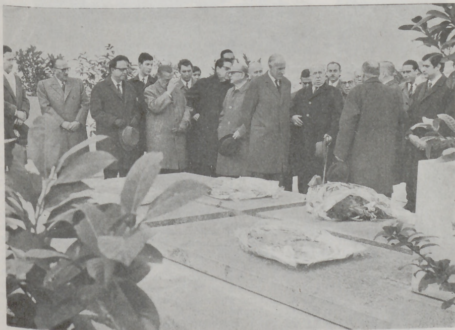
Los directivos de la Asociación de la Prensa de Madrid, acompañados de buen número de socios, acudieron al cementerio de Nuestra Señora de la Almudena para depositar coronas de flores sobre las tumbas de los periodistas caídos durante la Cruzada.

Los periodistas españoles celebraron con el fervor y la brillantez tradicionales la fiesta de su Santo Patrono, San Francisco de Sales. El pasado día 29 de enero multitud de actos, presididos por las autoridades civiles, eclesiásticas y militares,