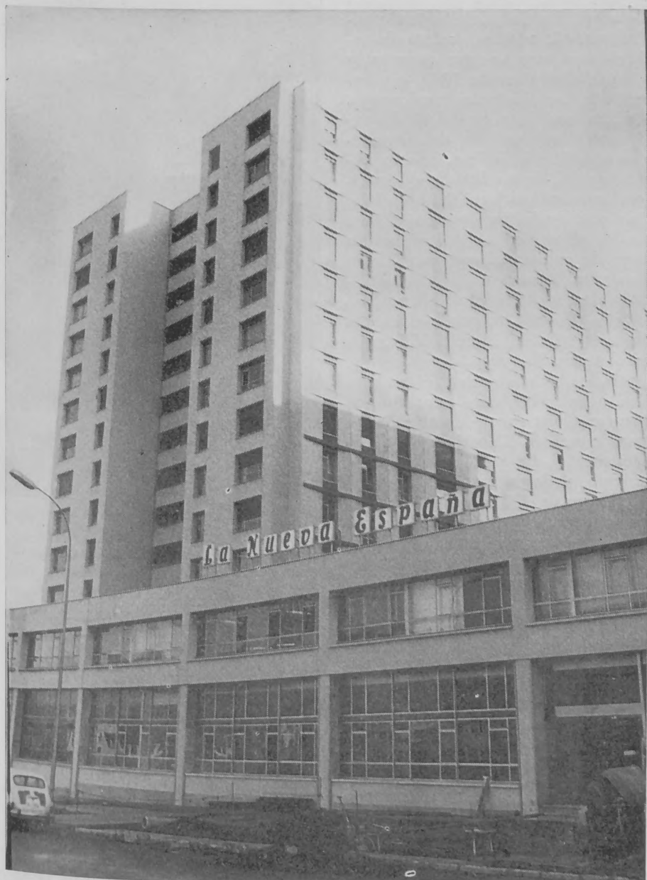
Vista de la fachada principal del espléndido edificio recién inaugurado por "La Nueva España", de Oviedo.