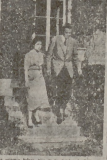
El príncipe Borja, hijo de los reyes de España, en un momento de su estancia en Bruselas.