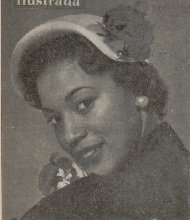
Portada del número uno de «Gaceta Ilustrada».

—Se han conseguido muchas exclusivas de agencias extranjeras, pero nuestro propósito es tratar de una manera lo más periodística posible los principales aspectos de la vida española.