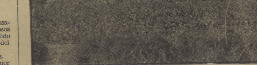
Una avanzadilla en el sector de Huesca. Puede verse en esta foto los magníficos refugios construidos para caso de bombardeo