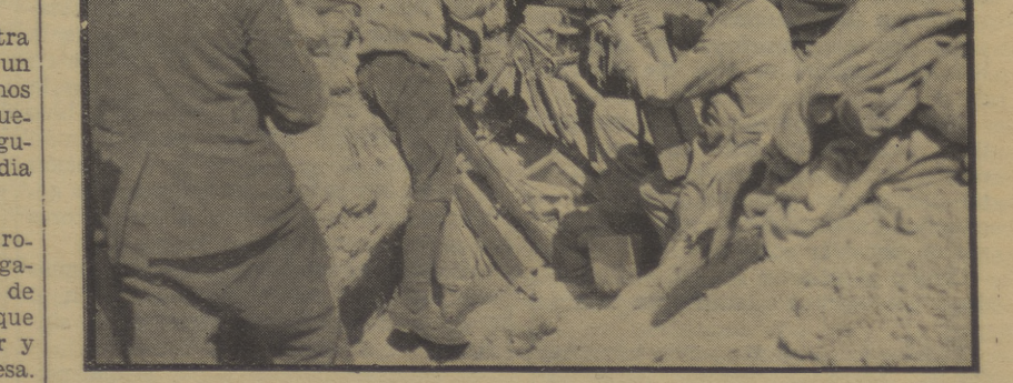
CASETAS DE QUICENA. — Desde esta avanzadilla nuestros camaradas atacan con fuego de fusil y ametralladoras a los facciosos

Mientras tanto, un crucero inglés está tranquilamente anclado en la parte exterior del puerto en posición de vigilancia. Dadas las circunstancias no parece estar lo más adecuado y quizá dentro de poco será ya imposible.