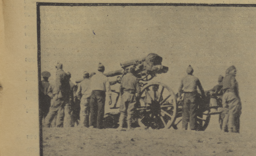
Nuestros camaradas empizando un cañón antiaéreo en Estrecho Quinto