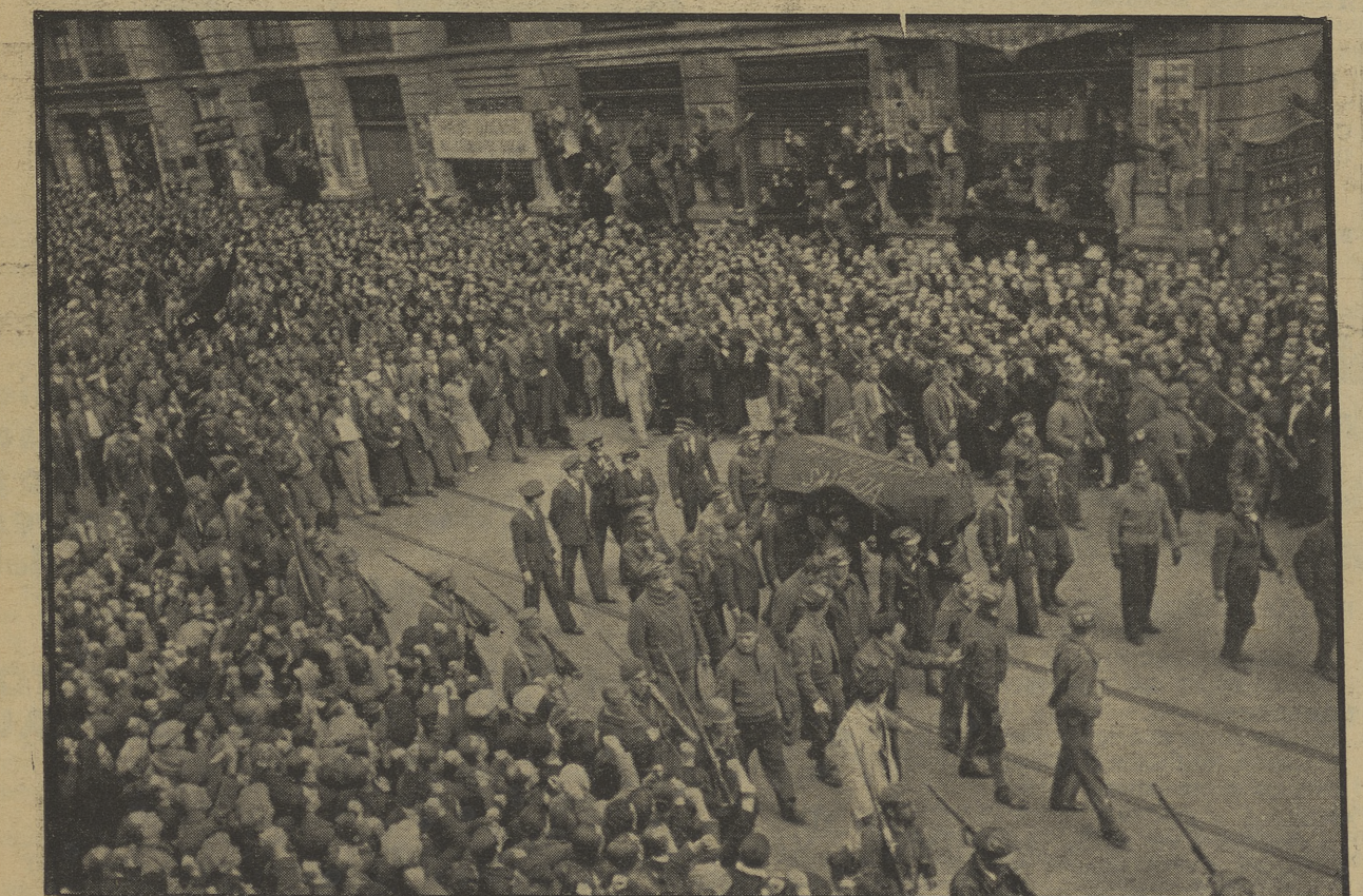
El entierro del camarada Durruti ha constituido una imponente manifestación de duelo, a la que ha contribuido todo el proletariado catalán, como lo prueban las dos fotos que publicamos. La de la parte superior: el paso de la comitiva por la Vía Layetana. En la foto de abajo: los restos del camarada Durruti llevados en hombros por milicianos de su columna