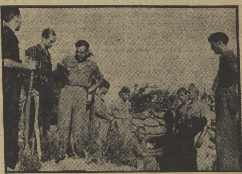
FRENTE DE ARAGON.—Una posición avanzada frente el pueblo de Perdiguera

Uno de los torpedos alcanzó al crucero «Cervantes», causándole averías. Los torpedos disparados contra el crucero, también, «Méndez Núñez», por otro submarino distinto al que atacó al «Cervantes», no hicieron blanco. N. de la R.: Hace ya unos cuantos días que Mussolini declaró «piratas» a varios submarinos que escaparon de bases italianas. ¿Serán éstos los que atacan a nuestra escuadra?