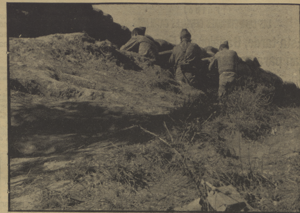
El enemigo intenta asaltar nuestras trincheras. Nuestros camaradas, desde ellas, rechazan el ataque, causándole grandes pérdidas

Las camaradas militantes y milicianos del P. O. U. M., deben pasar, a partir del lunes, de once a una y de cinco a siete, por estas oficinas de Alistamiento (plaza del Teatro, 2 y 4, pral.), a fin de recoger el carnet de miliciano del P. O. U. M. y el control de arma. Las camaradas que tengan el carnet rojo del Comité Central de Mujeres deberán traer una fotografía y los que no lo tengan, dos. Barcelona, 14 de noviembre de 1936.