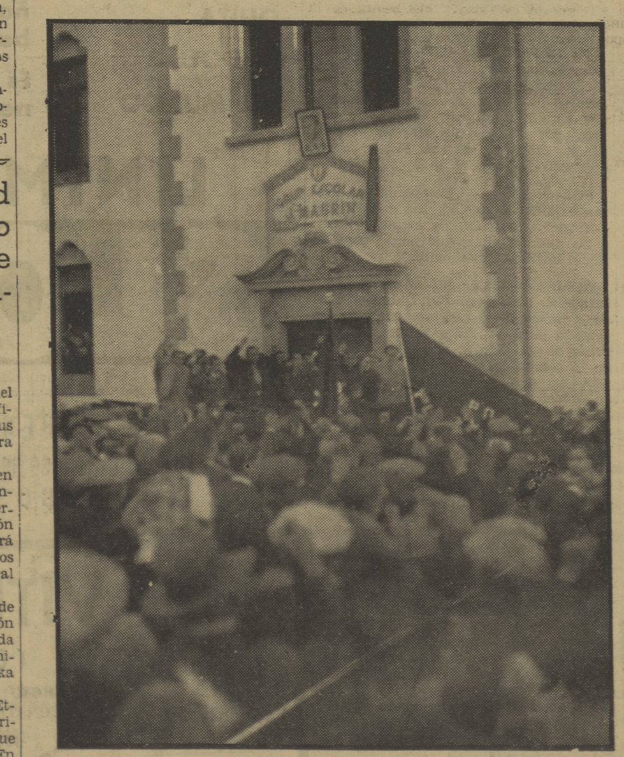
Momento de descubrir la placa que da el nombre de nuestro camarada Joaquín Maurín al Grupo Escolar de Puig Alt de Ter

El pasado domingo se descubrió la placa que da el nombre de Joaquín Maurín al Grupo Escolar de Puig Alt de Ter, tomando parte en el acto el Consejo de Justicia del Gobierno de Cataluña, camarada Andrés Nin, el cual fué presentado por el camarada Moréta y los concurrentes al emocionante acto. Nuestro camarada Nin pronunció un discurso en el que con frase vibrante enalteció la figura del que fué nuestro secretario general.