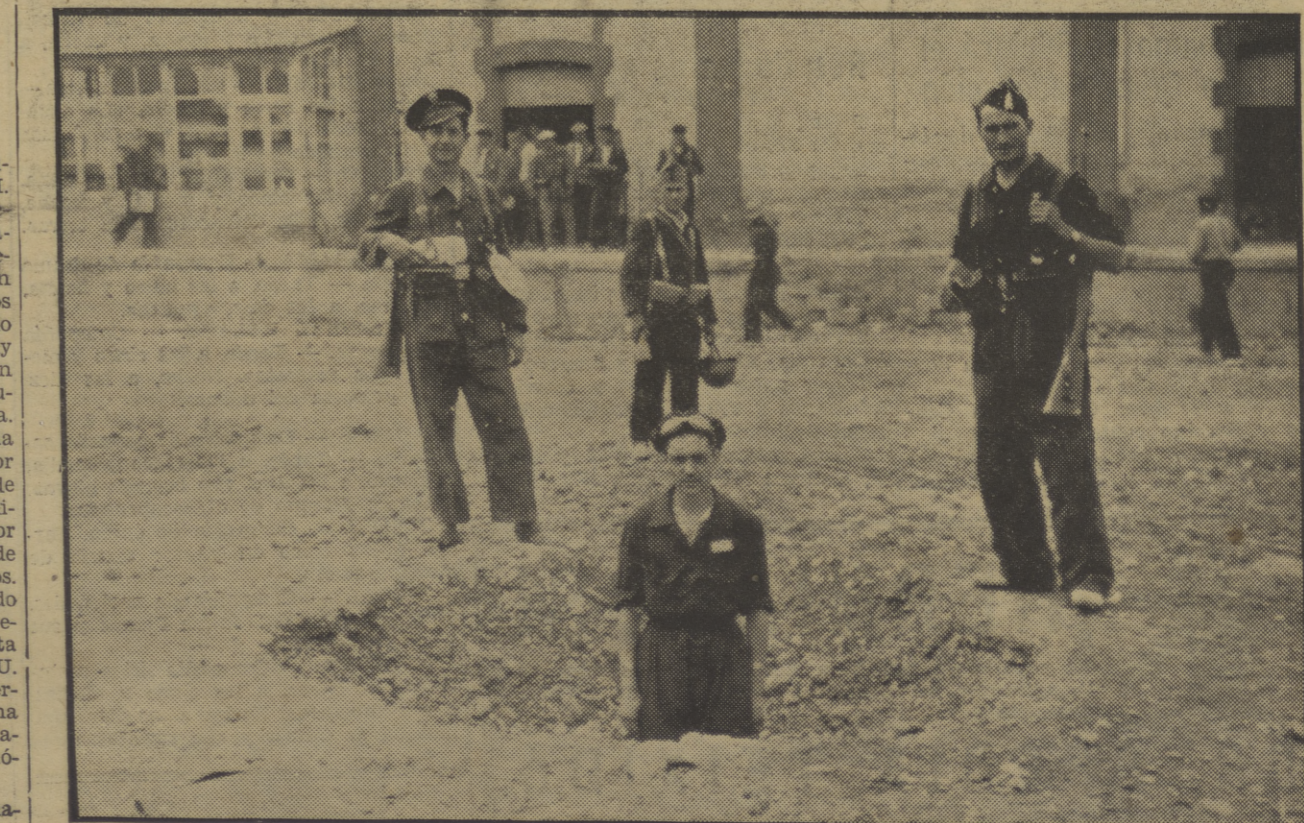
Esto es, sencillamente, el efecto de un bombardeo. Y, cada día, se tiran centenares de proyectiles por una parte y por otra...

Giustizia e Libertad publicó no hace mucho un interesante artículo suyo sobre la situación española, y por un artículo escrito contra Alfonso XIII sufrió la primera persecución policiaca. Su vida fué entregada por completo a la causa de la revolución proletaria.