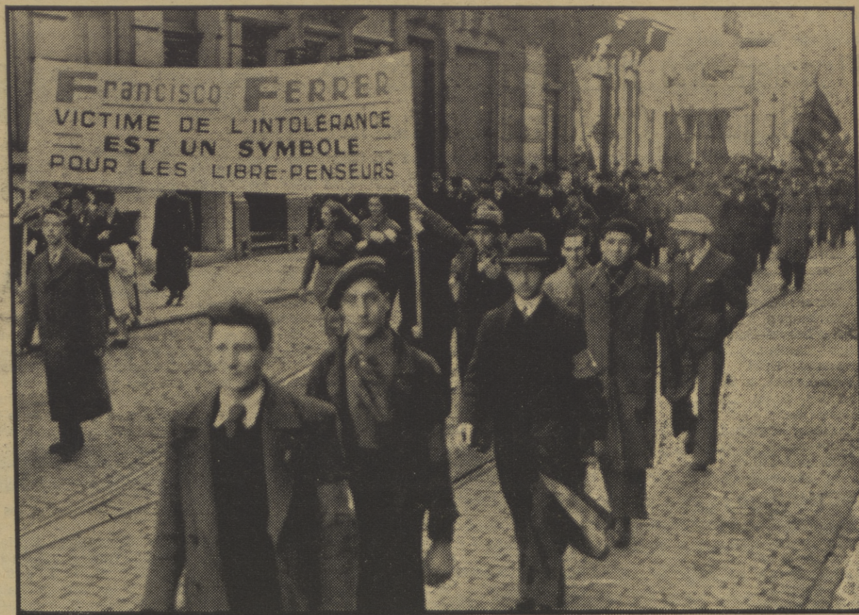
Los obreros y los librepensadores belgas han aprovechado el aniversario del fusilamiento de Ferrer y Guardia para manifestar su solidaridad hacia el proletariado español

Según hemos podido averiguar por unos vecinos de un pueblo cercano a Teruel, del que salieron hace unos días, la desmoralización entre los facciosos es enorme; carecen de casi todo y apenas si pueden comer, asegurando que la comida es siempre a base de sardinas en conserva y que muchos de los que están luchando en sus filas