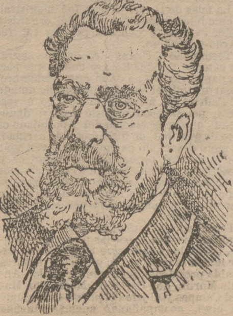
Manuel Tamayo y Baus