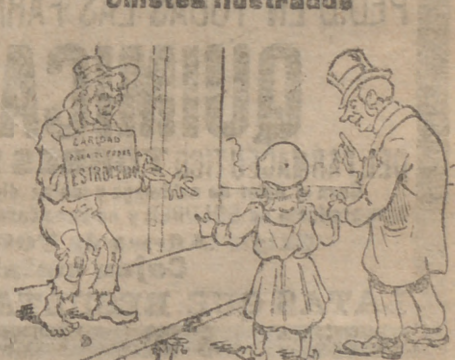
Papá, dale limosna á ese pobre. —No tengo sueldo, hijo. —Pues mamá ha dicho que, después de comer, has cambiado la peseta....