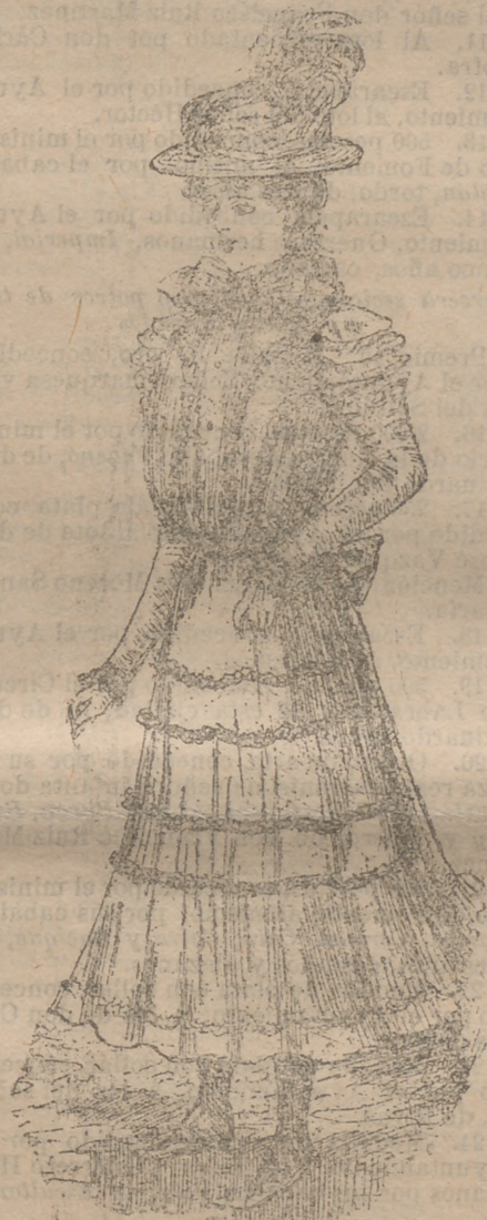
Traje para jovencita de once a catorce años