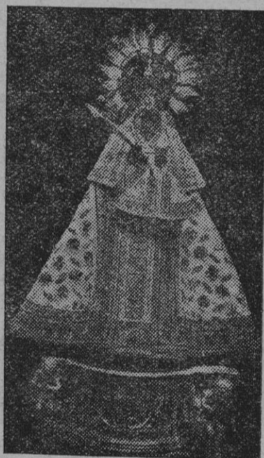
Imagen de la Virgen de Guadalupe, cuya coronación se celebra en el día de hoy.