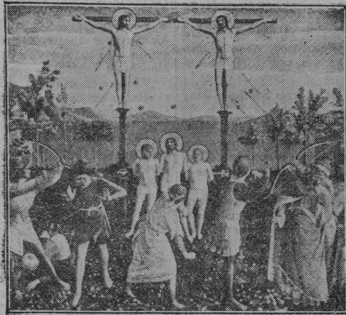
San Cosme y San Damián en la Cruz (Fray Angélico-Pinacoteca de Munich)

En cuanto a la aplicación del reglamento sobre circulación urbana, se ha acordado solicitar un informe del señor oficial Letrado del Ayuntamiento, sobre interpretación de diferentes extremos del mismo.