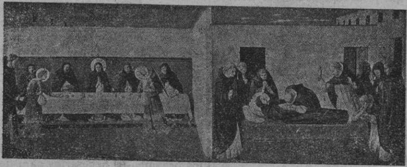
De la Vida de Santo Domingo por Fray Angélico (Iglesia de Jesús, de Cortona-Italia).