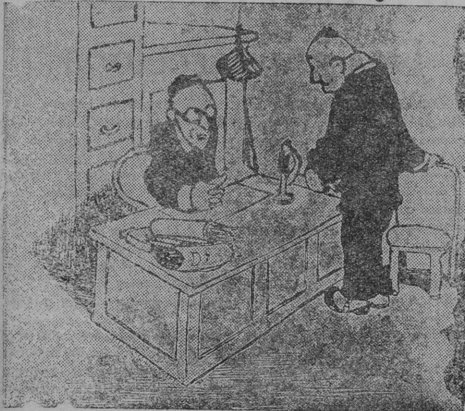
—Escuche, señor: ¿Podría prestarme... cinco minutos de atención? —¿Con mucho interés?