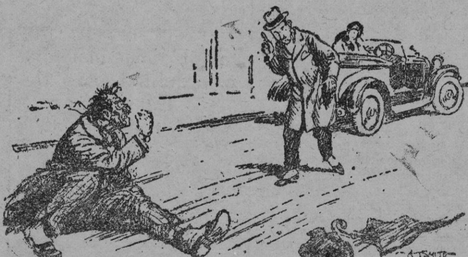
El automovilista fino

—Las gentes groseras de vuestra calaña, son las que hacen huir a los automovilistas.