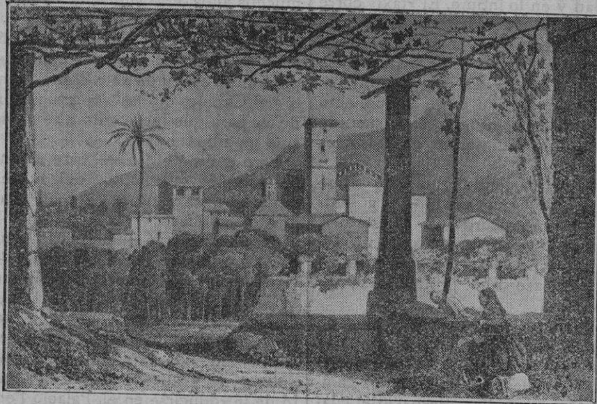
Del libro Souvenirs d'un voyage d'art a l'île de Majorque , por J. B. Laurens (1840). Vista general de Sóller, tomada desde el lado E., mirando hacia el puerto.

adhirió a las palabras del señor Uhler, diciendo que agradecía la ofrenda no tan sólo por lo que era en sí, sino más bien por lo que significaba, conceptuándola inmerecida por no haber hecho más que cumplir las órdenes del Gobernador. Bien justificado está el homenaje al Gobernador, mas no lo está en cuanto a mí. Dando las gracias a todos terminó el señor Parpal su breve discurso.