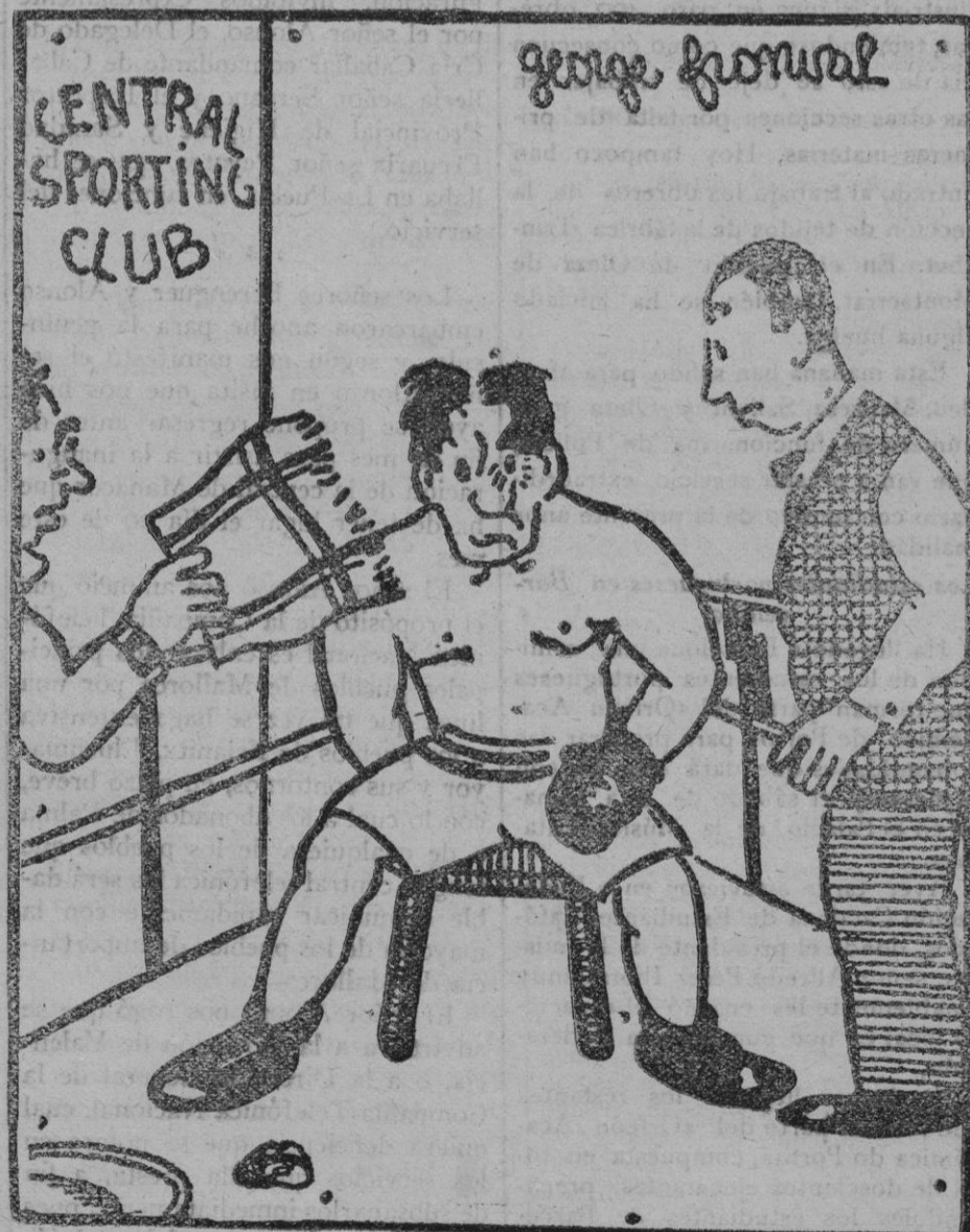
En el ring

De Argel a Palma.—Día 25 de cada mes a las 16.