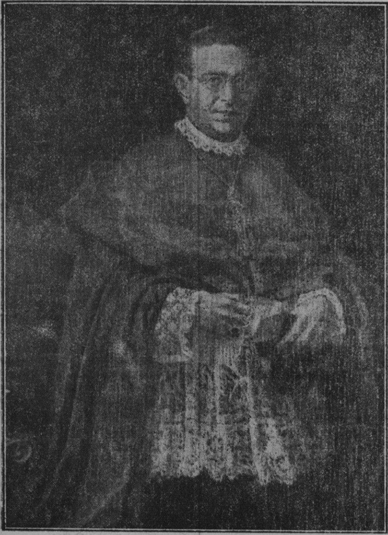
Retrato del nuevo Hijo Ilustre de esta ciudad Rvmo. P. Mateo Colom, Obispo de Huesca, obra debida al reputado pintor don Pedro Barceló.

HORAS DE DESPACHO de 10 a 1 y de 5 a 7 TELEFONO NUMERO 200