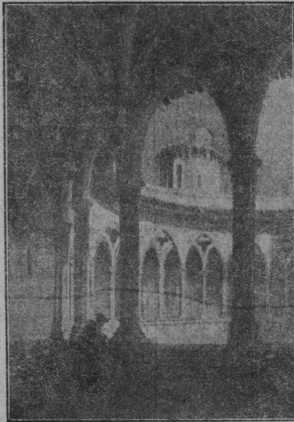
Del libro Souvenirs d'un voyage d'art a l'île de Majorque , por J. B. Laurens (1840). Interior del Castillo de Bellver.