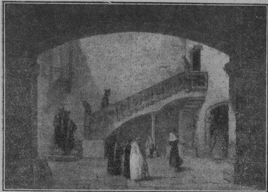
Del libro Souvenirs d'un voyage d'art a l'ile de Majorque , por J. B. Laurens (1840). Hermoso patio gótico que existía en el palacio del Conde de Ayamans.