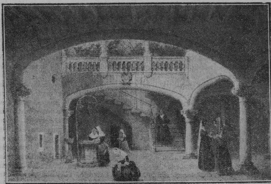
Del libro Souvenirs d'un voyage d'art a l'île de Majorque , por J. B. Laurens. Patio de la Casa de Oleza.

«Athletic», que jugó mucho más y mejor que los «blanqui-azules», cuya línea delantera fué la peor de todas; jugó sin la coordinación e inteligencia debidas y fué fácilmente contrarrestada por la línea media «Athlé-tica», con una facilidad increíble; luchó con empuje, pero sin entusiasmo y sin técnica e individualmente sus componentes, no hicieron gala de sus buenas facultades.