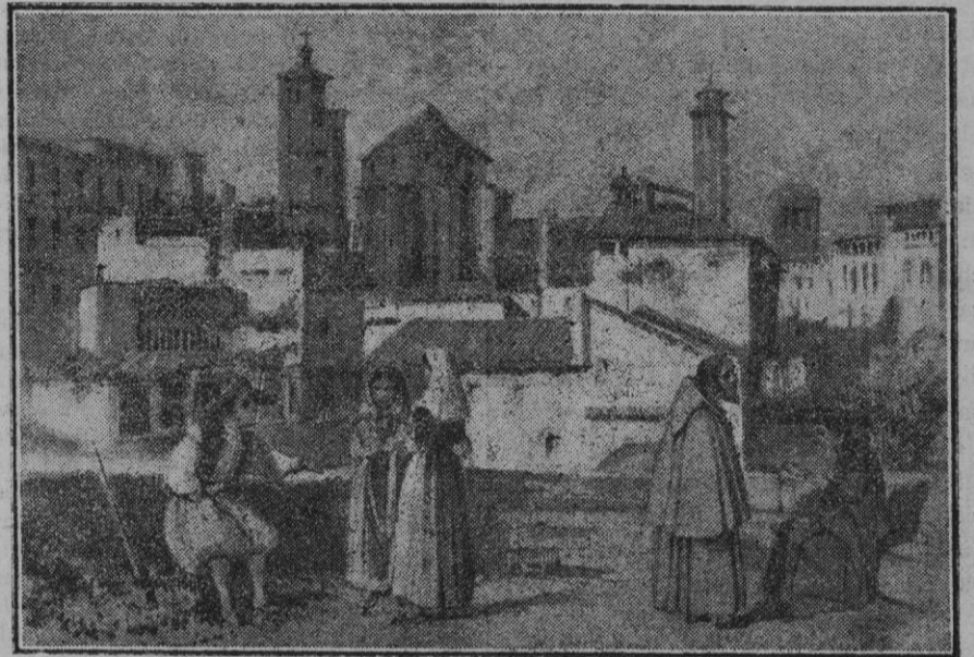
Del libro Souvenirs d'un voyage d'art a l'île de Majorque , por J. B. Laurens. Vista tomada desde las antiguas murallas, cerca de la Casa de Misericordia. En ella se ve el ábside de la iglesia del Santo Hospital.