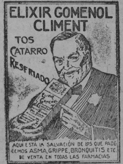
AQUI ESTA LA SALVACION DE LOS QUE PADECEMOS ASMA, GRIPPE, BRONQUITIS ETC. DE VENTA EN TODAS LAS FARMACIAS