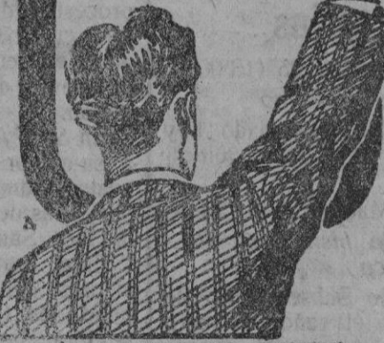
FARMACIA DE FARMACIAS Y QUIMICAS

Amigo DÉBIL QUE EL Elixir CALLOL DA FUERZA, VIGOR Y JUVENTUD y los Médicos le llaman el REMEDIO DE LOS DÉBILES