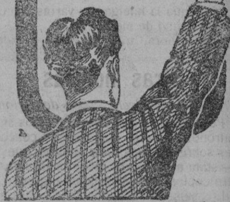
PIDASE EN FARMACIAS Y DROGUERIAS

y los Médicos le llaman el REMEDIO DE LOS DEBILES