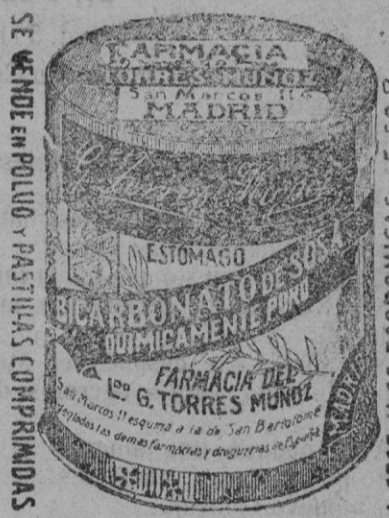
SE VENDE EN POLVO Y PASTILLAS COMPRIMIDAS

Plaza del Ferrocarril PRECIOS SIN COMPETENCIA