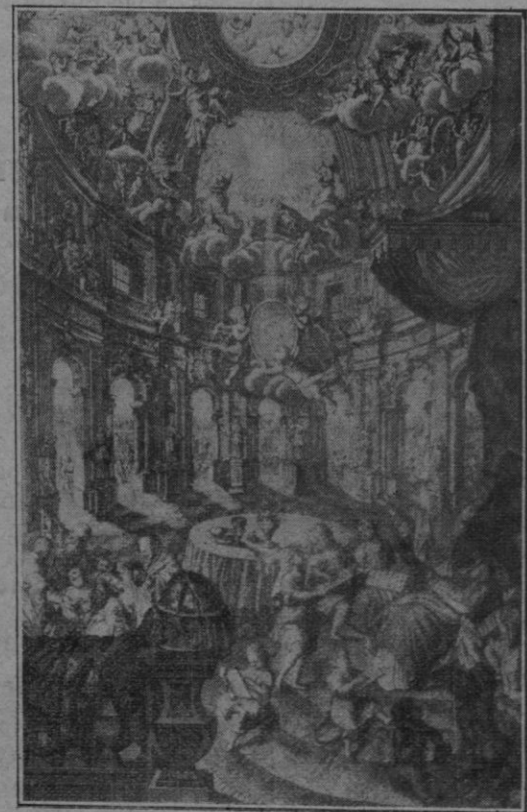
Portada de la notable edición de las obras del Beato hecha en Maguncia