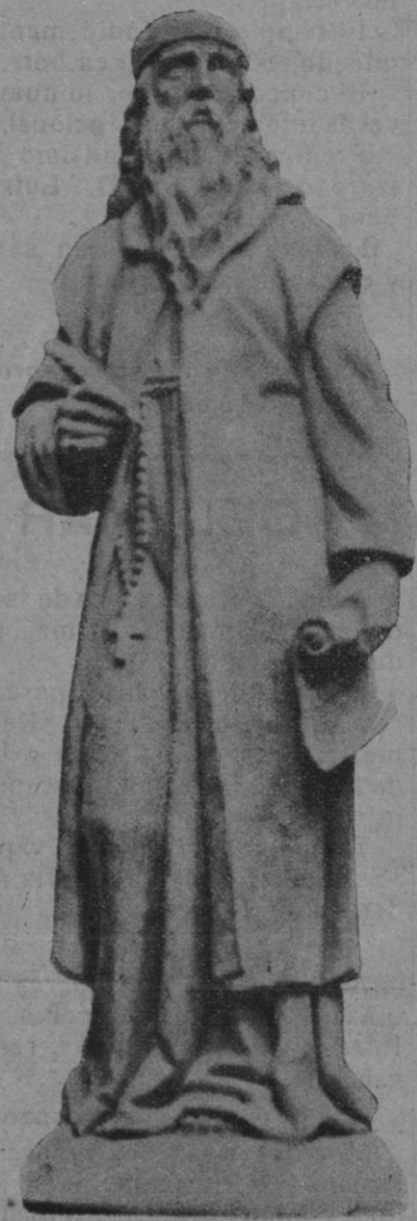
Imagen del Beato Ramón Lull