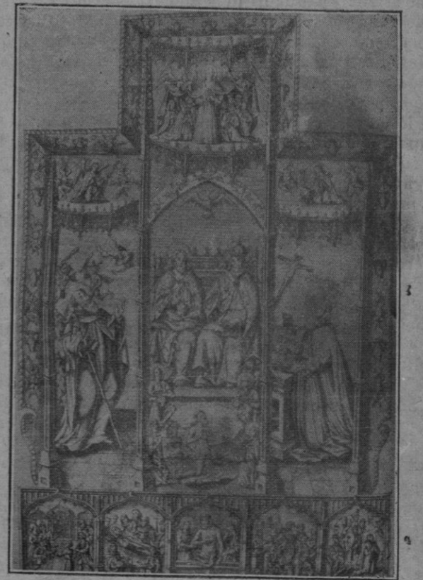
Antiquísimo retablo que contiene — a la derecha del lector — una de las primeras imágenes del Beato