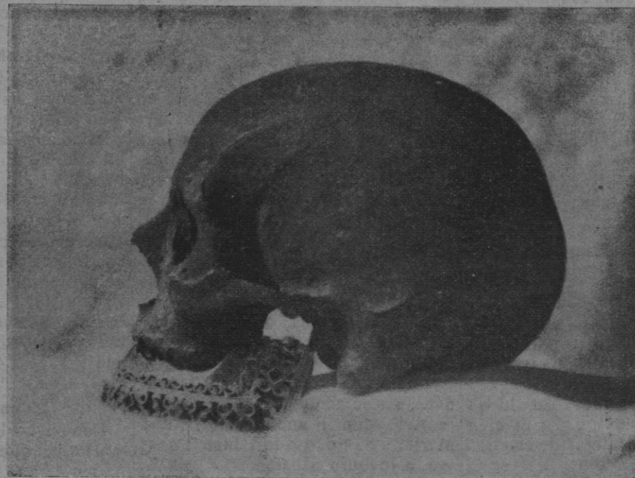
Venerable calavera del asombroso sabio e ínclito mártir mallorquín