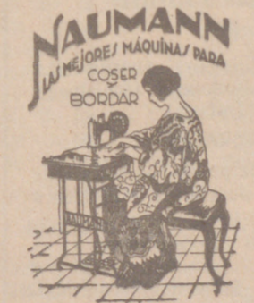
Máquinas coser NAUMANN. Bobina central. Precios más barato que nadie.