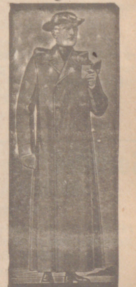
Guardapolvos de dril, a 20, 22 y 25 pesetas.