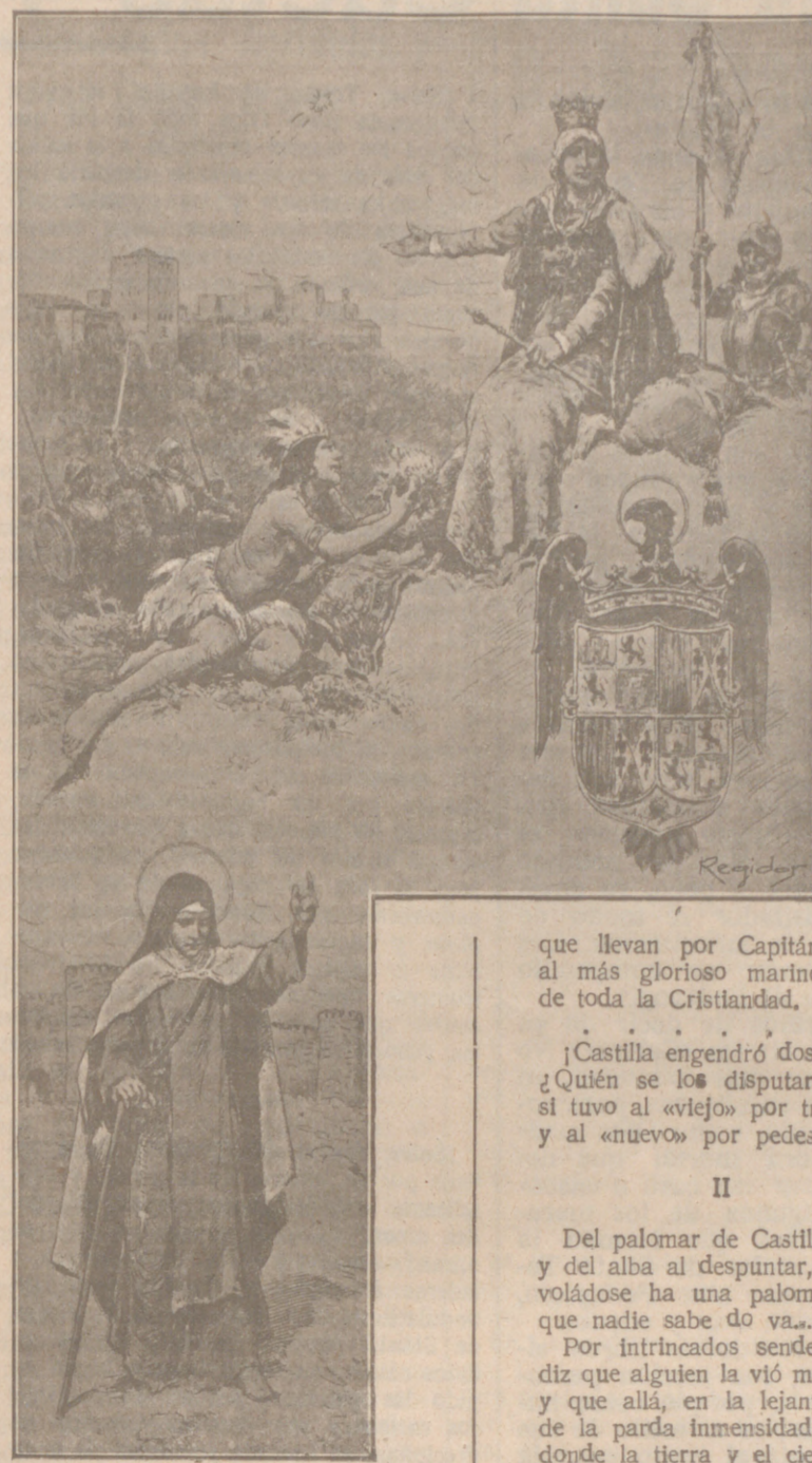
CARABELAS DE CASTILLA