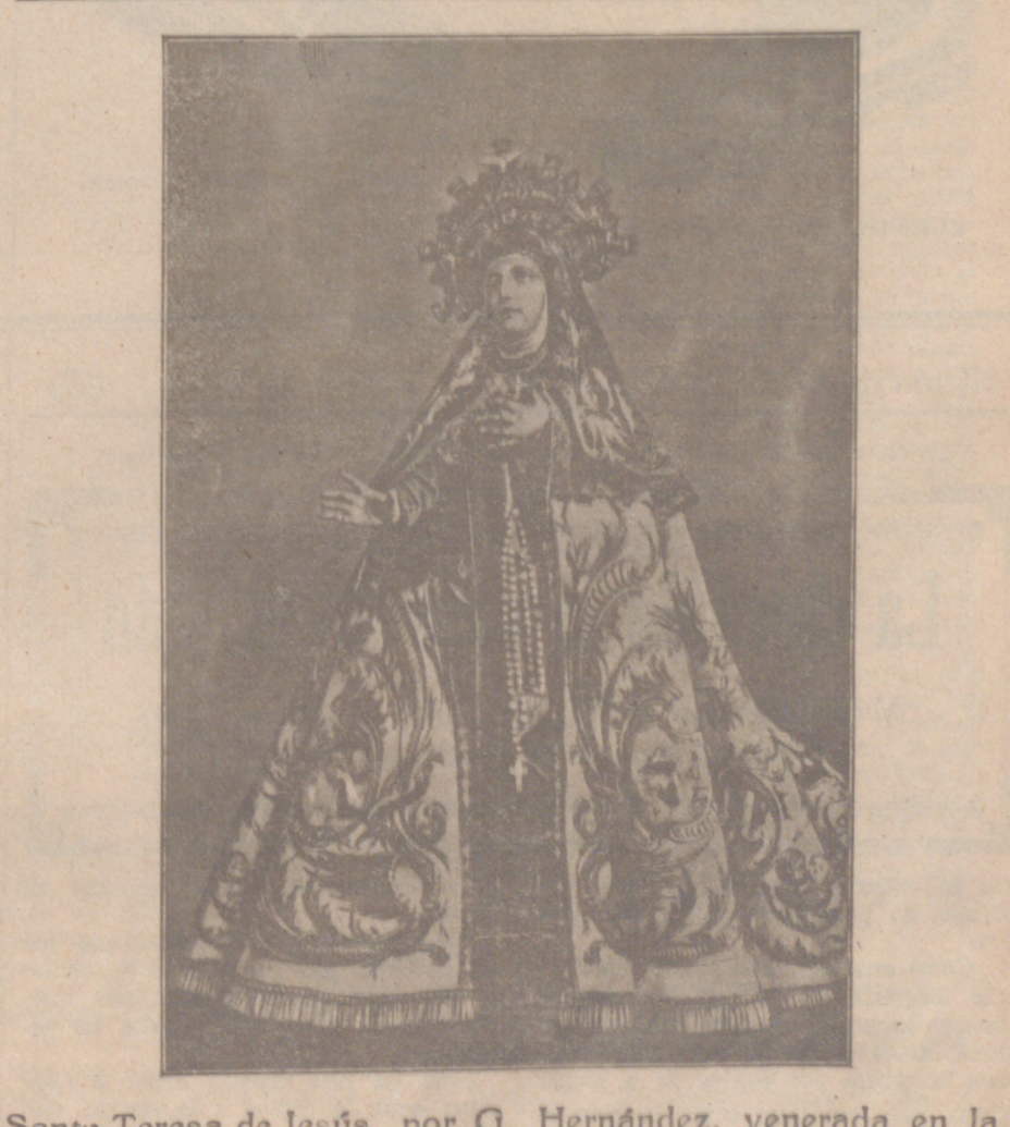
Santa Teresa de Jesús, por G. Hernández, venerada en la capilla aparte en la iglesia de la Santa (Avila), ubicada en el lugar donde nació a este mundo.