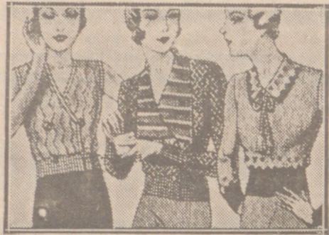
Blusas punto novedad a 5, 6, 8, 10 y 12 ptas.

Casa Munguía (Plaza Mayor, 48 y Lain Calvo, 9) Sucursal: Plaza Mayor, 5 BURGOS Primera casa en confecciones para caballero, señora, jóvenes y niños. Tejidos, Pañería y Sastrería