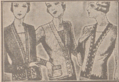
Blusas chaquetitas de 7, 8, 10, 12 y 15 ptas.