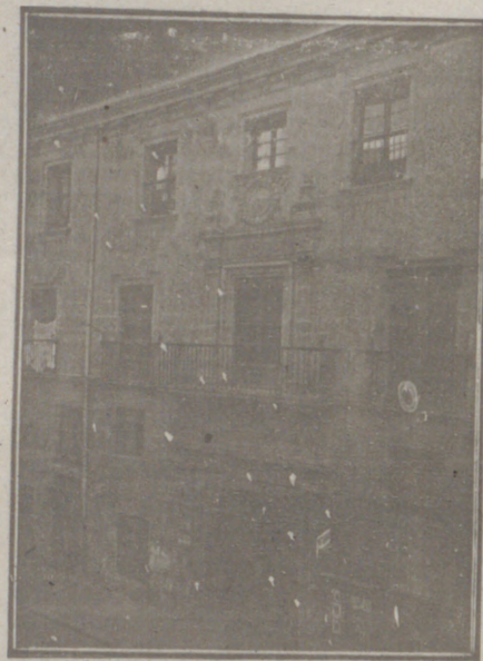
Entrada a las Oficinas de la Federación y MUTUALIDAD AGRÍCOLA BURGALESA. Calle de Santander, números 10, 12 y 14. Burgos.

Un accidente en vuestros obreros, criados, pastores o en vosotros mismos, puede causar grave daño económico o la ruina en vuestra casa.