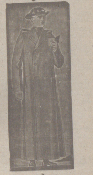
Impermeables, de 90, 100 y 118 ptas. Guardapolvos de dril forma dullea, a 18, 20 y 25 y 80 ptas.