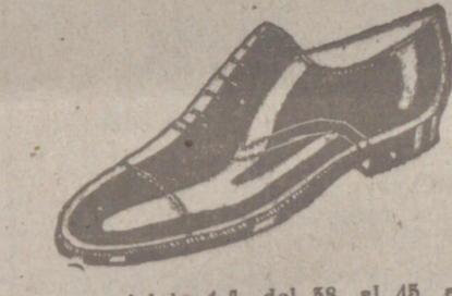
Zapatos piel de 1.ª, del 58 al 45, a 18 ptas. Zapato charol, a 19'80. LIMPIEZA GRATIS