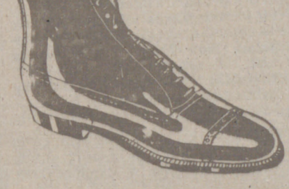
Botas clase 1.ª «Segarra», a 19'80. pesetas. Piel de hierro, a 19'80. Piel de hierro piso goma, a 18 ptas.