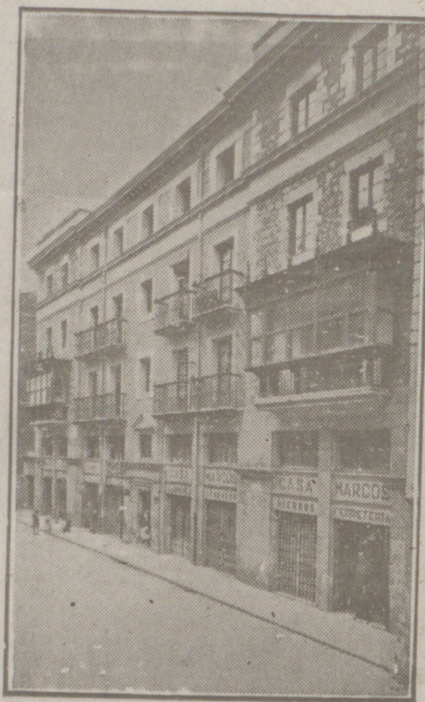
Fachada, por la calle de la Moneda números 15 y 17, de la CASA SOCIAL propiedad de la Federación Burgalesa de Sindicatos Agrícolas Católicos.

Se hallan establecidas en su planta baja las Oficinas y talleres de máquinas de «El Castellano» y «El Defensor de los Labradores»