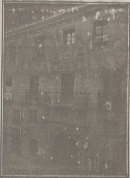
Entrada a las Oficinas de la Federación y MUTUALIDAD AGRÍCOLA BURGALESA. Calle de Santander, números 10, 12 y 14. Burgos.

Un accidente en vuestros obreros, criados, pastores o en vosotros mismos, puede causar grave daño económico o la ruina en vuestra casa.