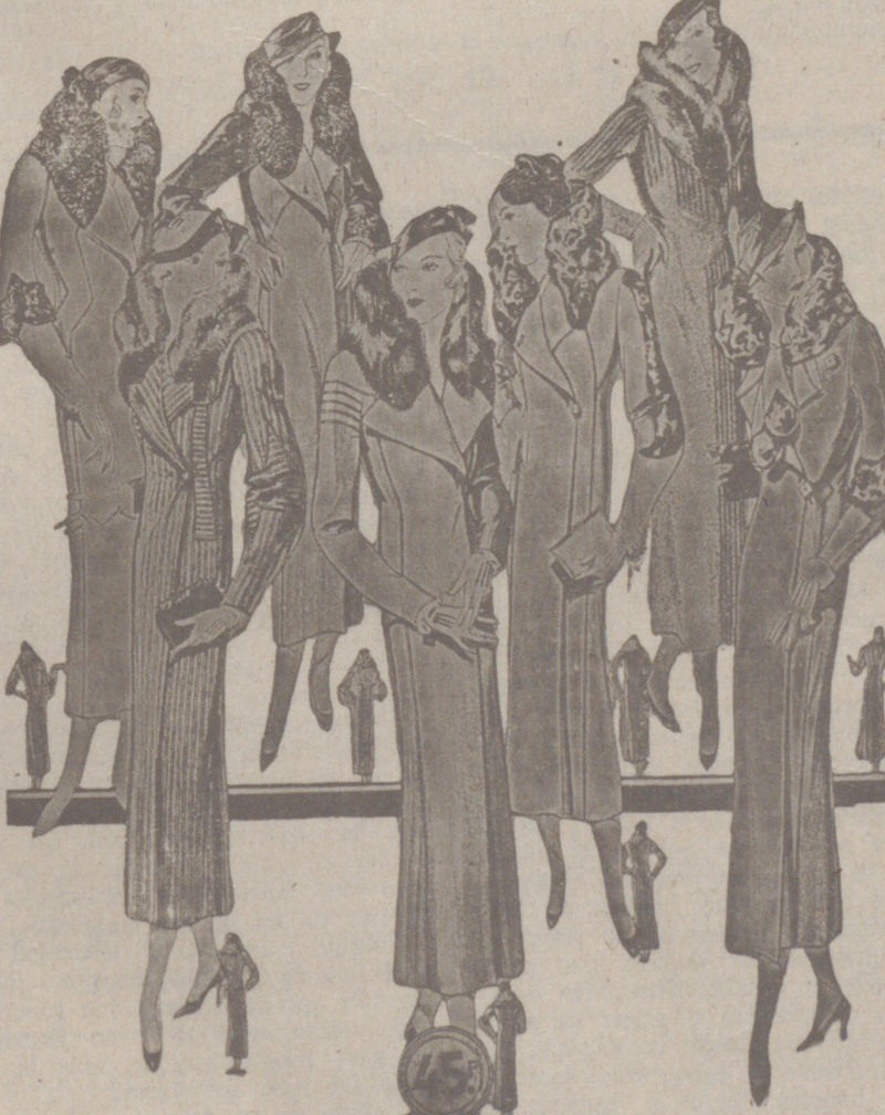
80 Modelos distintos en Abrigos Camuzas NOVEDAD. - Modelos, creación Parísien a 20, 30, 40, 50, 60, 70, 80 y 100 pesetas