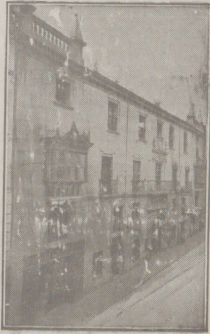
Fachada, por la calle de Santander, 10, 12 y 14, de la CASA SOCIAL propiedad de la Federación Burgalesa de Sindicatos Agrícolas Católicos.

En ella están las Oficinas de la FEDERACIÓN, CAJA DE AHORROS, MUTUALIDAD AGRÍCOLA BURGALESA y Redacción y Administración de «El Castellano» y «El Defensor de los Labradores».