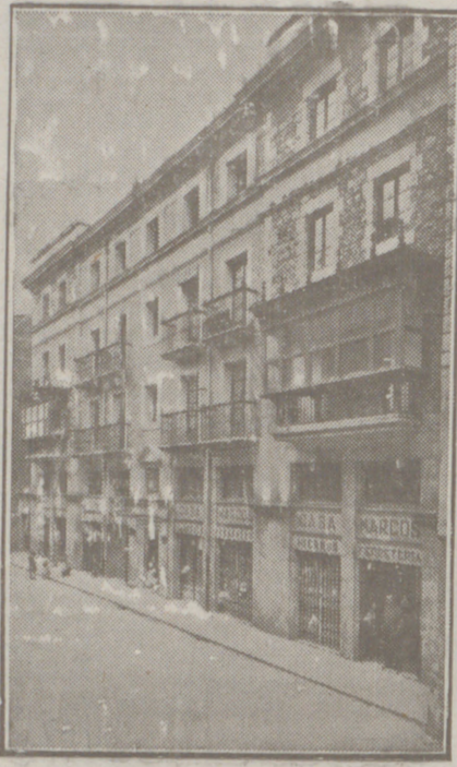
Fachada, por la calle de la Moneda números 10 y 17, de la CASA SOCIAL propiedad de la Federación Burgalesa de Sindicatos Agrícolas Católicos.

Un accidente en vuestros obreros, criados, pastores o en vosotros mismos, puede causar grave daño económico o la ruina en vuestra casa.