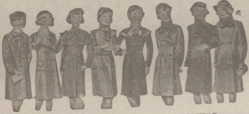
ABRIGOS PARA NIÑAS - MODELOS NOVEDAD, de 18, 20, 25, 30 y 40 pesetas.

Casa Munguía Plaza Mayor 42 y Lala Catvo 9 Sucursal: Plaza Mayor, 5 BURGOS Primera casa en confecciones para caballero, señora, jóvenes y niños. — Tejidos, Pañería y Sastrefía.