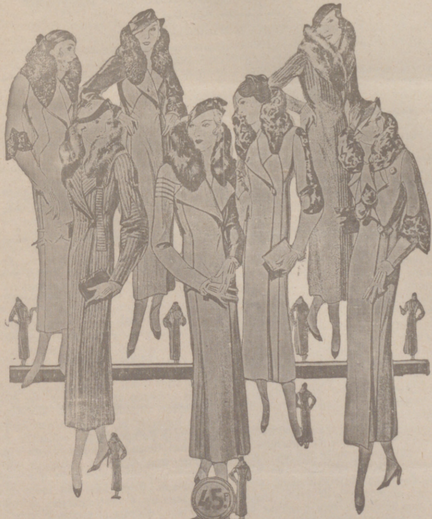
Modelos distintos en Abrigos Gamuzas NOVEDAD.—Modelos, creación; Parísien a 25, 30, 40, 50, 60, 70, 80 y 100 pesetas