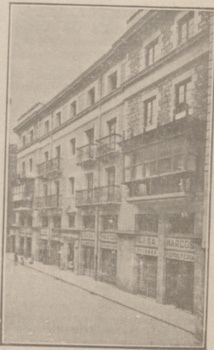
Fachada, por la calle de la Moneda números 15 y 17, de la CASA SOCIAL propiedad de la Federación Burgalesa de Sindicatos Agrícolas Católicos.

Se hallan establecidas en su planta baja las Oficinas y talleres de máquinas de «El Castellano» y «El Defensor de los Labradores»