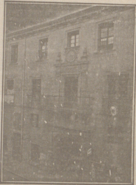
Entrada a las Oficinas de la Federación y MUTUALIDAD AGRÍCOLA BURGALESA Calle de Santander, números 10, 12 y 14, Burgos.

Un accidente en vuestros obreros, criados, pastores o en vosotros mismos, puede causar grave daño económico o la ruina en vuestra casa.