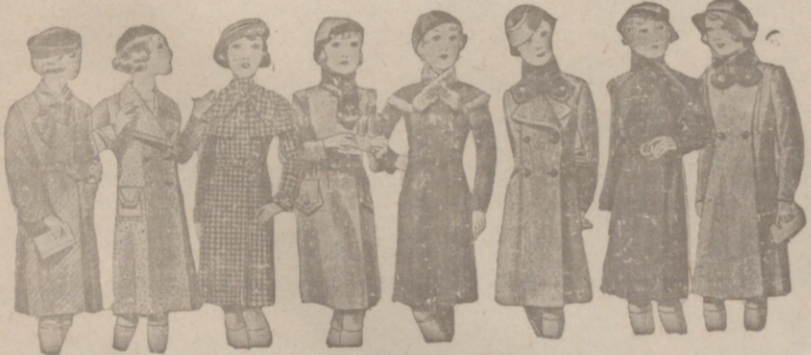
ABRIGOS PARA NIÑAS — MODELOS NOVEDAD, de 15, 18, 20, 25, 30 y 40 pesetas.

Casa Munguía Plaza Mayor 42 y Lala Calvo 9. Sucursal Plaza Mayor, 5 BURGOS. Primera casa en confecciones para caballero, señora, jóvenes y niños. — Tejidos, Pañería y Sastrería.