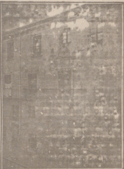
Entrada a las Oficinas de la Federación y MUTUALIDAD AGRÍCOLA BURGALESA. Calle de Santander, números 10, 12 y 14. Burgos.

En ella están las Oficinas de la FEDERACIÓN, CAJA DE AHORROS, MUTUALIDAD AGRÍCOLA BURGALESA y Redacción y Administración de «El Castellano» y «El Defensor de los Labradores»