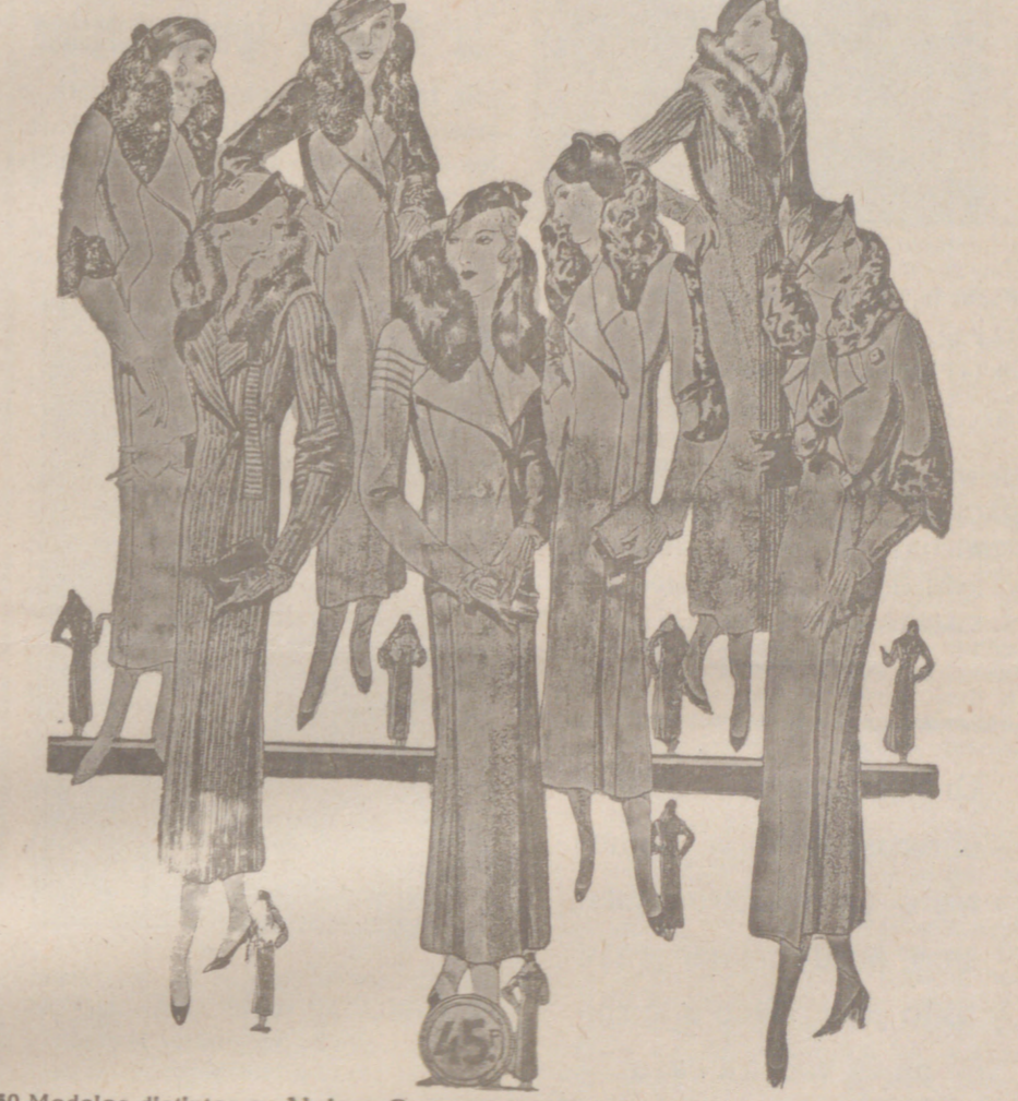
60 Modelos distintos en Abrigos Gemuzas NOVEDAD.—Modelos, creación Parlatón a 25, 30, 40, 50, 60, 70, 80 y 100 pesetas

CEMENTOS REZOLA El mejor cemento español Representación y depósito: Julio Puente Carcaga ESPOLON, 2 CASA OLIVAN BURGOS