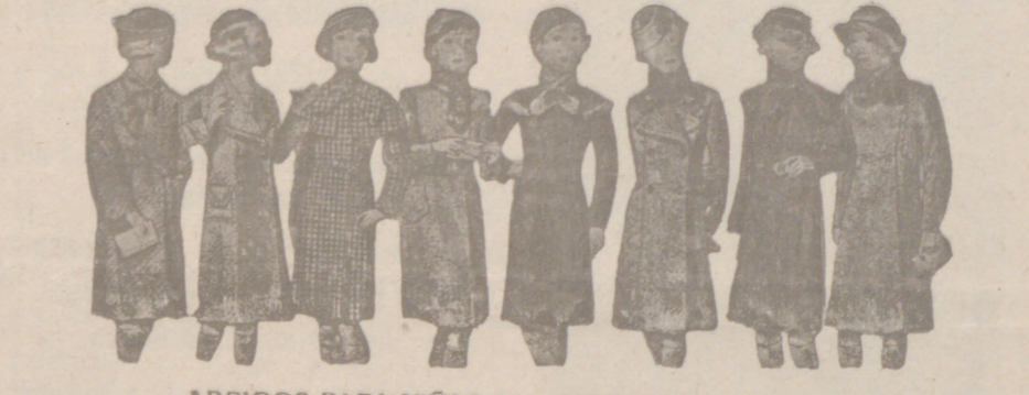
ABRIGOS PARA NIÑAS MODELOS NOVEDAD, de 15, 18, 20, 25, 30 y 40 pesetas.