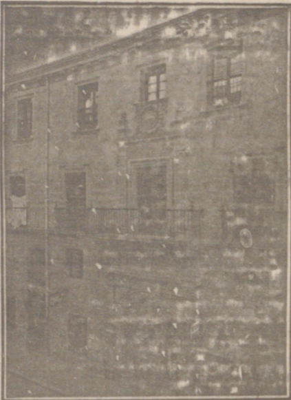
Entrada a las Oficinas de la Federación y MUTUALIDAD AGRÍCOLA BURGALESA. Calle de Santander, números 10, 12 y 14. Burgos.

En ella están las Oficinas de la FEDERACIÓN, CAJÁ DE AHORROS, MUTUALIDAD AGRÍCOLA BURGALESA y Redacción y Administración de «El Castellano» y «El Defensor de los Labradores»