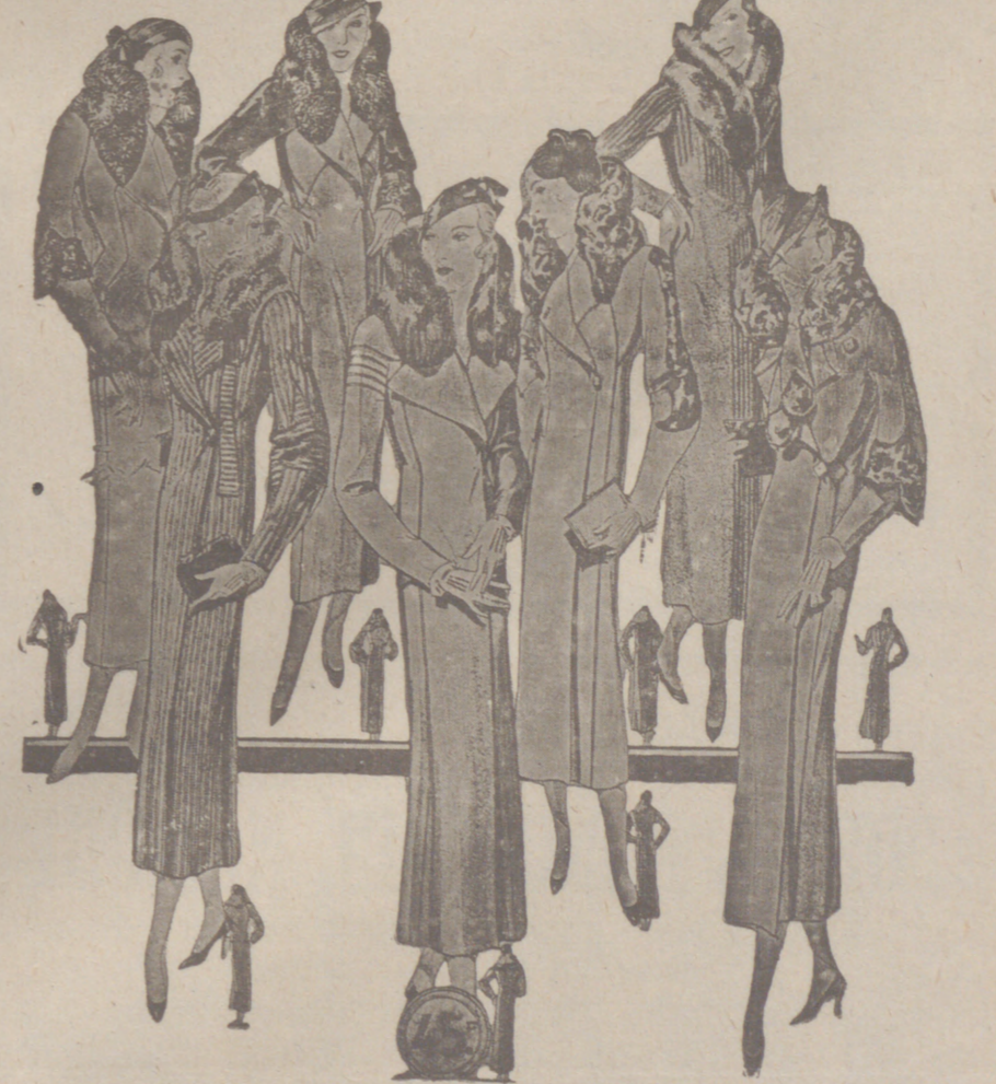
60 Modelos distintos en Abrigos Gamuzas NOVEDAD.—Modelos, creación Parísien a 25, 30, 40, 50, 60, 70, 80 y 100 pesetas

ABRIGOS PARA NIÑAS - MODELOS NOVEDAD, de 15, 18, 20, 25, 30 y 40 pesetas.