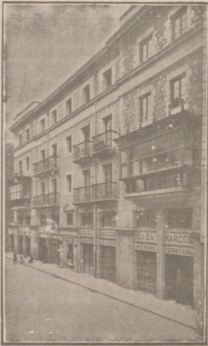
Fachada, por la calle de la Moneda, números 16 y 17, de la CASA SOCIAL propiedad de la Federación Burgalesa de Sindicatos Agrícolas Católicos.

No confundirse: Calle de Santander, (Casa de la Federación) - Burgos