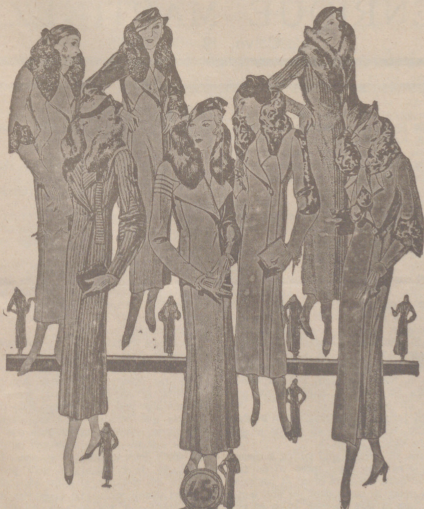
50 Modelos distintos en Abrigos Gamuzas NOVEDAD.-Modelos, creación Parlelón a 25, 30, 40, 50, 60, 70, 80 y 100 pesetas