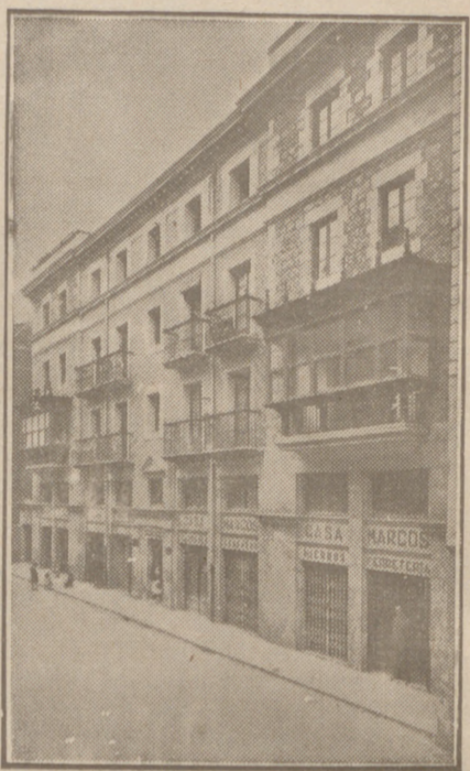
Fachada, por la calle de la Moneda, números 15 y 17, de la CASA SOCIAL propiedad de la Federación Burgalesa de Sindicatos Agrícolas Católicos.

Se hallan establecidas en su planta baja las Oficinas y talleres de máquinas de «El Castellano» y «El Defensor de los Labradores»