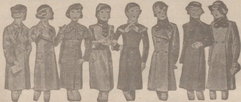
ABRIGOS PARA NIÑAS - MODELOS NOVEDAD, de 15, 18, 20, 25, 30 y 40 pesetas.

Casa Munguía Plaza Mayor 42 y Lala Calvo 9 Sucursal: Plaza Mayor, 5 BURGOS