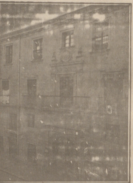
Entrada a las Oficinas de la Federación y MUTUALIDAD AGRÍCOLA BURGALESA. Calle de Santander, números 10, 12 y 14. Burgos.