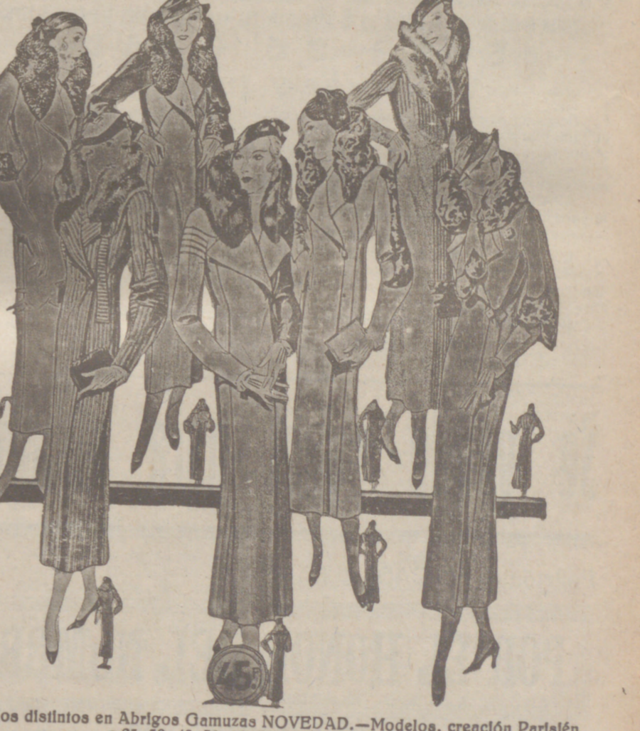
80 Modelos distintos en Abrigos Gamuzas NOVEDAD.—Modelos, creación Parísien a 25, 30, 40, 50, 60, 70, 80 y 100 pesetas