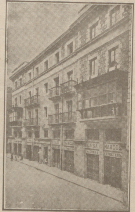
Fachada, por la calle de la Moneda, números 15 y 17, de la CASA SOCIAL propiedad de la Federación Burgalesa de Sindicatos Agrícolas Católicos.

Se hallan establecidas en su planta baja las Oficinas y talleres de máquinas de «El Castellano» y «El Defensor de los Labradores»