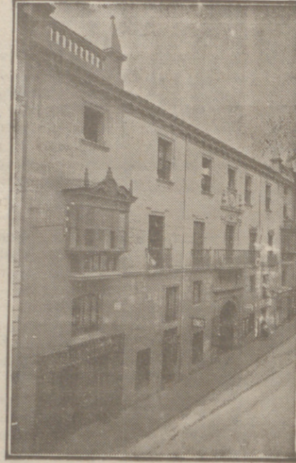
Fachada, por la calle de Santander, 10, 12 y 14, de la CASA SOCIAL propiedad de la Federación Burgalesa de Sindicatos Agrícolas Católicos.

En ella están las Oficinas de la FEDERACION, CAJA DE AHORROS, MUTUALIDAD AGRICOLA BURGALESA y Redacción y Administración de «El Castellano» y «El Defensor de los Labradores»