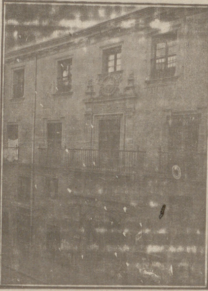
Entrada a las Oficinas de la Federación y MUTUALIDAD AGRICOLA BURGALESA. Calle de Santander, números 10, 12 y 14. Burgos.