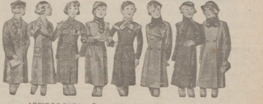
ABRIGOS PARA NIÑAS — MODELOS NOVEDAD, de 15, 18, 20, 25, 30 y 40 pesetas.

Primera casa en confecciones para caballero, señora, jóvenes y niños. — Tejidos, Pañería y Sastrefía.